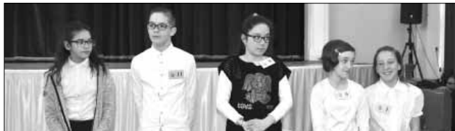
Továbbjutók III. korcsoport