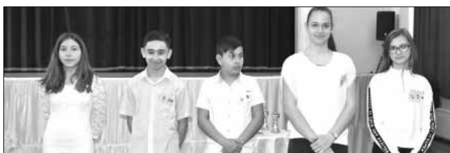
Továbbjutók IV. korcsoport