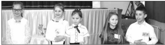
Továbbjutók II. korcsoport