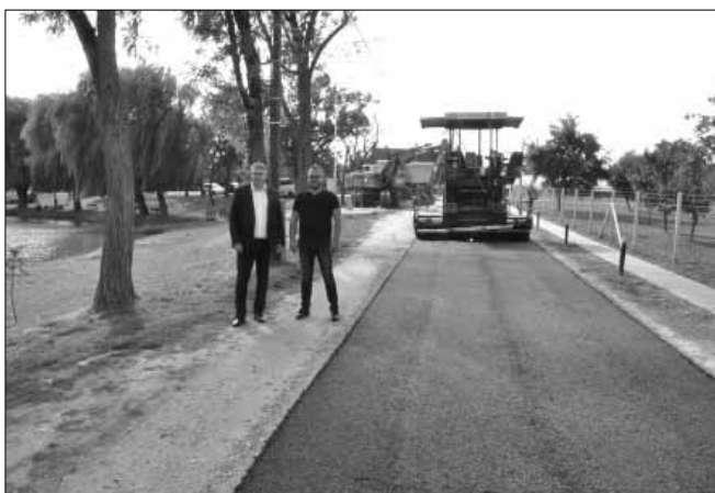
Az ősze elején a Hargita sétányon egy 505 méter hosszú, három méter széles vegyes forgalmú út épült, mely aszfaltburkolatú úton a kerékpárosok mellett személygépjárművek is közlekedhetnek maximum 30 km/h sebességgel