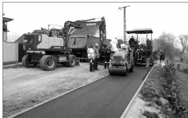
Az ősze végén a Körös utca Kossuth utca és „Kispalló” híd közötti szakaszán 220 méter hosszú és 2 méter széles aszfaltburkolatú kerékpárút épült