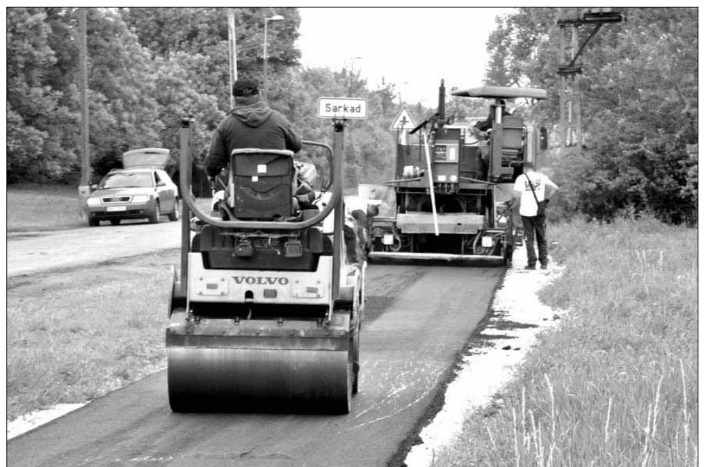
Az idén tavasszal 1.360 méter hosszban és 2,25 méter szélességben aszfaltburkolatú kerékpárút épült az Anti úton, a belterületi határtól az ökörményi feljáróig

Természetesen a legszükségesebb javításokat pályázati források híján is igyekezett elvégezni az önkormányzat, így többek között 2017-ben 5,5 millió forintot biztosított a képviselő-testület a Vasút utcai, a Gyulai úti, az Anti úti, az Ady Endre utcai, a Kossuth utcai és a Szalontai úti kerékpárutak legrosszabb állapotú és balesetveszélyes szakaszainak javítási munkálataira, melyek így mintegy 600 m 2 alapterületen kaptak új aszfaltburkolatot. Emellett többek között a szökőkutas körforgalmi