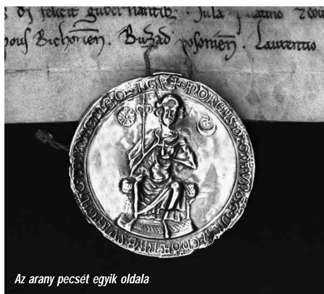
Az arany pecsét egyik oldala