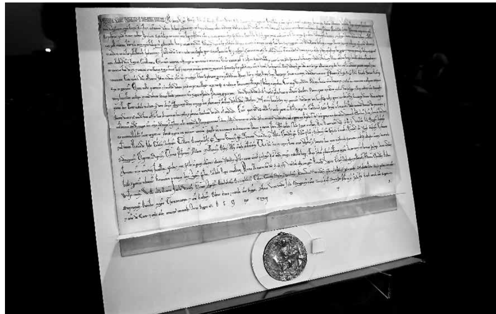
Az Országgyűlési Múzeumban látható Aranybulla. A vitrinben kiállított példány a levéltár munkatársainak szakmai segítségével készült rekonstrukció, az eredeti állapot bemutatására

A vér tényleg nem válik vízzé? Első ízben történt, hogy minden politikai szereplő egyetértésével döntés született, miszerint kivétel nélkül mindenki, még az uralkodó fölött is valami hatalmasabb erő áll, a TÖRVÉNY. A 31 cikkelyből álló Aranybulla tisztázza a nemesi rendek (szabadok) jogait, kötelességeit. Mai nyelven szólva, például kimondja a tulajdon és a személy sérthetlenségét, a gyűlekezési és szólásszabadságot. Csakis bizonyítékok, tanúk vagy tettenérés esetén lehet bárkit letartóztatni, akkor, ha azt a pártatlan bíróság elrendeli. Ez a törvényesség, jogállamiság. Amibe 1990-ben tértünk ismét vissza. Az Aranybulla megpróbálkozott a kör négyesítésével: rend a szabadságban, szabadság a