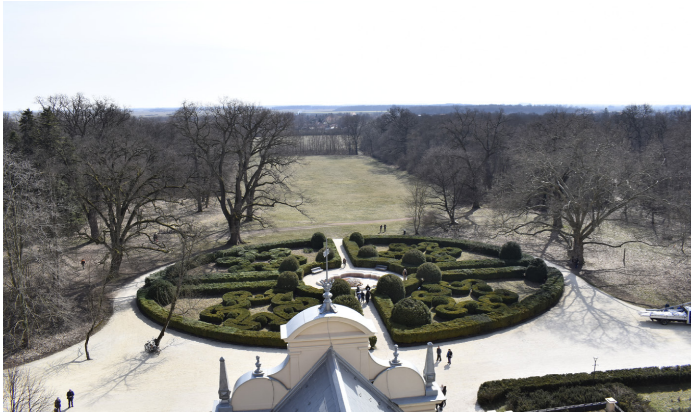
15. kép/Pict. 15: Szabadkígyós, Wenckheim-kastély – kastélypark rekonstrukció / Reconstruction of Wenckheim Castle Garden in Szabadkígyós

a természeti, a teremtett világ tiszteletén alapuló kapcsolatot környezetünkhöz, önmagunkhoz. A szegregálódott gondolkodást, a tudomány, a művészet és a társadalom szétforgácsolódását és öncélúságát ismét összművészeti tenni, humánussá formálni és kozmoökológiai tudatra emelni. Nagyon fontosnak tartom publikálni, szakmai és népszerűsítő könyveket kiadni, konferenciákat szervezni - kezdeményezője és szervezője vagyok a Mőcsényi Mihály nemzetközi konferenciának -, a kertművészet és a többi művészeti ág, a tudomány és társadalmi, turisztikai összefüggésében egyaránt.