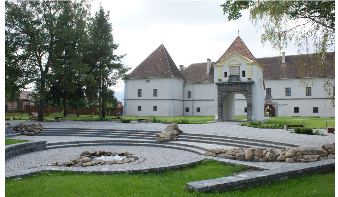
16. kép/Pict. 16: Csíkszereda, Mikó vár – vár környezetének kertépítészeti megújítása / Landscape renewal of the surroundings of Mikó Castle in Csíkszereda, (Miercurea Ciuc)

type of intellectual impulse from the future. Therefore, at an individual level, it is inevitably important to pursue a path of self-awareness and knowledge about the world, alongside high professional skills. To rely not on fashion or trends in the creative process but the presence of the spirit. Hungary has historically had a high garden and landscape culture as part of its cultural and social life. Our task today is to make this heritage widely known in society and cultural life. All this is to foster a humane relationship with our environment and ourselves based on respect for nature and the created world. To humanise segregated thinking, the disintegration and self-sabotage of science, art and society and reinstate into a most diverse artistic environment while raising a cosmo-ecological consciousness. I consider it essential to publish and share professional and promotional books and to organise conferences - I am the initiator and an organiser of the Mihály Mőcsényi International Conference Series - in the context of garden art and other artistic disciplines and science, social and tourism context.