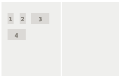
1. kép/pict. 1: Könyvborító / Book cover 2. kép/pict. 2: Mikoviny Sámuel / Sámuel Mikoviny