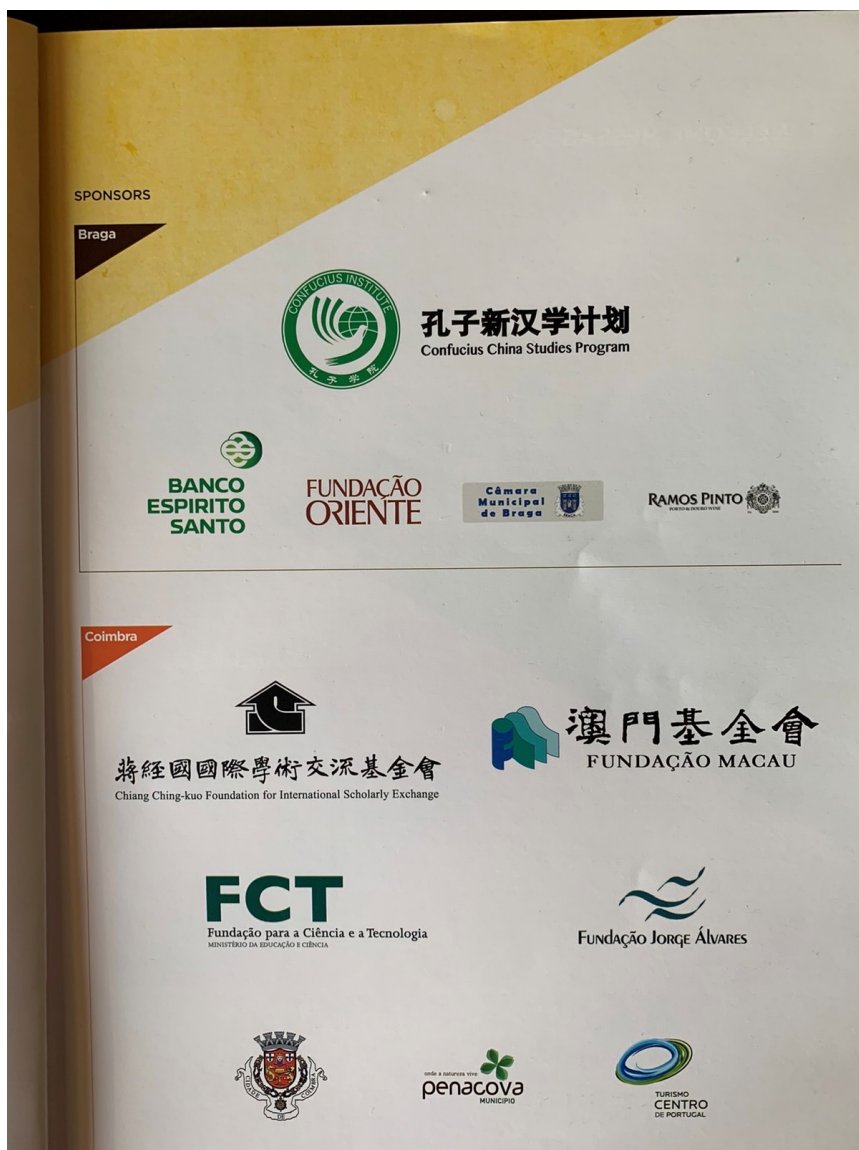
2. kép. A 2014-es bragai EACS konferencia brosúrájának a szponzorokat tartalmazó oldala (Fotó: Prof. Dr. Hamar Imre, 2020. január 10.)