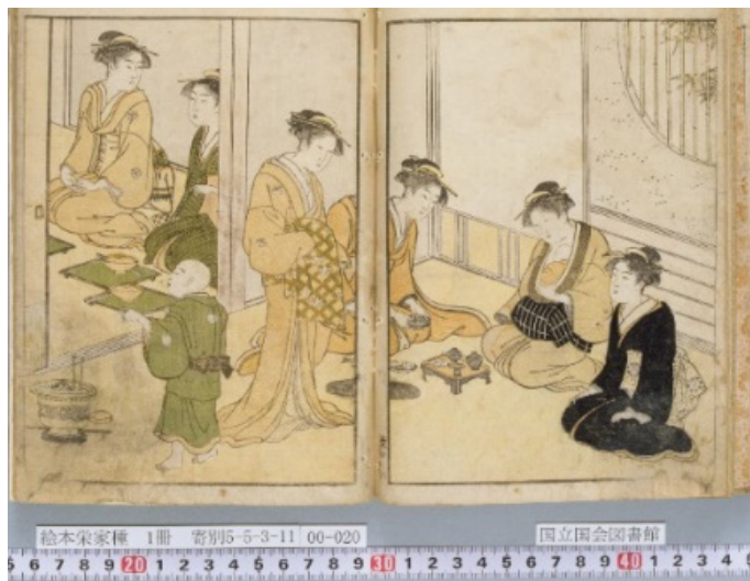
3. kép Ehon sakae gusa 2. kötet 8. oldal. (Japán Parlamenti Könyvtár digitális állomány)