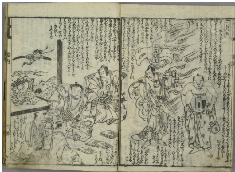
4. kép Sakusha tainai totsuki no zu

„A yin-yang egy cseppjének vizéből fogan a gyermek. A festéktartó vizének egy cseppjéből fogan a történet magja. Aztán ha apa nélküli gyermek fogan, az az írónak nem probléma. Ám ha valaki lányának gyermekéről van szó, abból aztán nagy botrány lesz.” (3ウ, 4. kép jobb oldala)