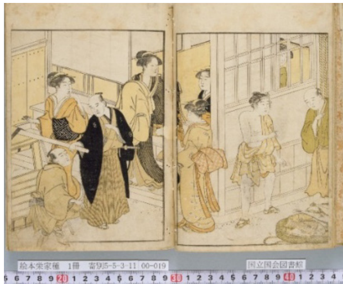
2. kép Ehon sakae gusa 2. kötet 7. oldal. (Japán Parlamenti Könyvtár digitális állomány)