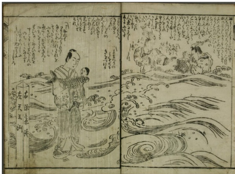
6. kép Hakoiri musume menyá nyígyő

(Halemberek:) „Hozz gyorsan egy lámpást, kisbaba sírását hallom!” (Urashima Tarō:) „Ajhaj, te szegény! Ha nem a sárkánykastély népe közül való volnál, legszívesebben én nevelnék fel. Ha Ryōgokuban bemutatlak volna, biztosan nagy visszhangra leltünk volna. Jajj de kár....”