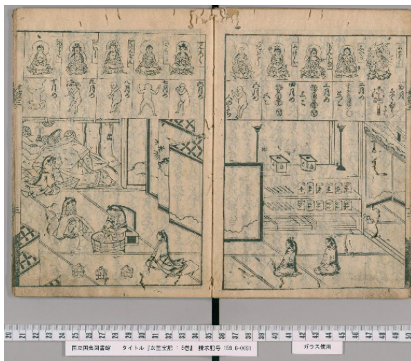
1. kép Onna chōhōki 3. kötet. (Japán Parlamenti Könyvtár digitális állomány). A kép felső sorában a magzatábrázolás, az alsó részén egy rangos nő szülése, a megszületett gyermek fürdetése.

bizonyítványokban bemutatott magzatképpel és az obi iwai rítusával is párhuzamot mutat, hogy az 5. hónapi magzatábrázolás mellett (1. kép) az 'emberi forma' ( hito no katachi 人のかたち) feliratot olvashatjuk.