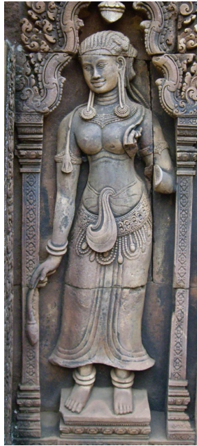
4. kép Új típusú sampot devatā alakon. Banteay Srei, déli szentélytorony keleti oldal (a szerző felvétele)

hagyományozódásuk, átalakulásuk, egymásra hatásuk hogyan történt. A forma és a tartalom változása mennyiben volt párhuzamos, hogyan nyertek új jelentést azonos formák vagy fordítva. Felmerült a kultúrák egymásra hatásának és legalább ennyire az archaizálás különböző módjainak kérdésköre is. Ebben az esetben, amikor egy épület tereiben elsősorban a falfelületeken elhelyezkedő ábrázolásokat vizsgáljuk, kiemelt jelentősége van annak, hogy az adott ábrázolás az épület mely részén és a többi ábrázoláshoz viszonyítva hol látható. Ikonográfiai vizsgálat során nem hagyható figyelmen kívül az adott ábrázolás rituális funkcionális problémáinak sem, amely mögött adott esetben a „művészi szempontrendszer” – amennyiben erről egyáltalán beszélhetünk – háttérbe szorulhatott. Angkor és Banteay Srei esetében igen fontos kérdés, hogy az ábrázolások mely szöveges instrukciórendszer követik az indiai eredetű hagyományon belül. Az ikonográfiai vizsgálati módszerek természetesen nem függetleníthetők az ikonológiától, hiszen a műalkotások – még ha a kelet-ázsiai művészet megértése során egészen más típusú fogalomrendszerben kell is gondolkodnunk – valamiféle stílusba, létrejöttük történelmi kontextusába és egyben kronológiai rendbe is besorolhatók.