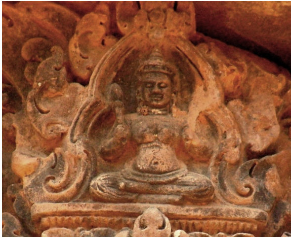
5. kép Annapurna alakja.

Banteay Srei déli könyvtárépület keleti szemöldökköve (a szerző felvétele)