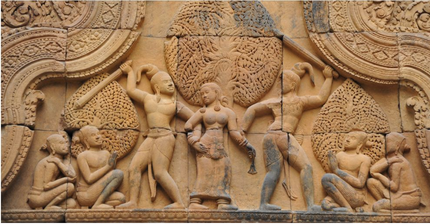
2. kép „Tilottamā elrablása”, Banteay Srei, 3. keleti kapu oromzata. Musée Guimet. Itsz. 18913

ábrázolása a mitológiában ennyire különböző rangot betöltő szereplőkön számtalan kérdést vet fel az ikonográfiai szabályok és az előírások feltételezett alkalmazásával kapcsolatban.