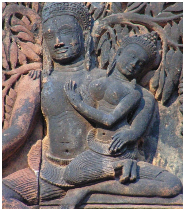
3. kép Hagyományos típusú sampot Pārvatīn a Rāvaṇānugraha-mūrti domborművön. Banteay Srei, déli könyvtárépület keleti oromzat (a szerző felvétele)

Tilottamā apsara viseli ezt a szoknyát, mindannyian – az istennőkhöz képest – alacsonyabb rangú mitológiai szereplők. Könnyen elképzelhető, hogy míg az istennőket az akkor már „klasszikusnak” mondható tradicionális, pliszírozott viseletben kellett az ikonográfia köztudatban is jelen lévő előírásai szerint megjeleníteni, addig a devaták ábrázolásakor kevésbé kötött szabályok szerint lehetett eljárni, így az alkotó szabadabban formálhatta a megjelenésüket, vagy egyenesen a munkához szellemi háttérrel biztosító írástudó papok kérésére történt a szereplők „világiasabb” stílusban való felöltöztetése.