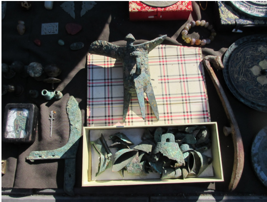
3. kép Régiségpiac Pekingben

Emellett a komoly múlttal rendelkező sírbróker és a lelőhelyek módszeres fosztogatása 28 is jelentős kihívások elé állítja az archeológusokat (3. kép). 29 A régészeti leletek gyűjtésével üzletszerűen foglalkoznak, sokan legális cégüket használva álcaként, 30 és az illegális műkincs-kereskedelem olyannyira virágzik, hogy a Közel-Kelet vérbe borulásáig Kínát mint az egyik legjellemzőbb elrettentő példát emlegették művészettörténész és régész körökben. 31 Nehéz ugyan pontos becslést adni az ellopott javak számáról, mindenesetre 1998 és 2003 között a kínai állami kulturális örökségi hivatal szerint mintegy 220 000 sírt fosztottak ki, és az eltulajdonított leletek nagy része külföldi kézbe vándorolt. 32 Aggasztó tendencia, hogy a kínai újjazdag réteg körében divattá vált a régiségek gyűjtése, amit ráadásul tévéműsorok egész során keresztül népszerűsítenek. 33