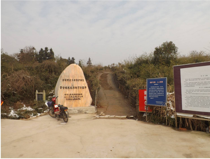
4. kép Feljárat a szigorúan őrzött császári temetkezéshez Nanchang környékén

délyezettési procedúráján kell átesni, amely a külföldiek számára nem látogatható lelőhelyek, illetve a zajló ásások esetében még összetettebb. A törvény egyes cikkelyei ellen vétőkkel szemben határozottan fellépnek. 38 Mindez jelentősen behatárolja a külföldiek tudományos lehetőségeit, még a publikálatlan leletek és lelőhelyek megtekintését (nemhogy kutatását) is el lehetetlenítve (4. kép).