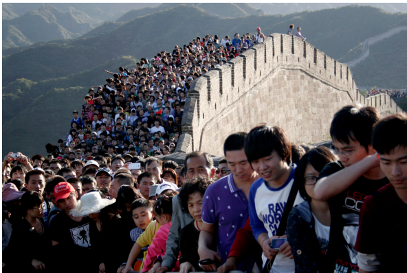
2. kép A Nagy Fal egy népszerű szakasza

növekvő igényeit – többek között – a régészeti örökség bevonásával kellett kielégíteni. Manapság tehát a lelőhelyek turisztikai célpontokká történő alakítása gazdasági és nemzeti érdekeket is szolgál. 24 Ennek előnye, hogy számos műemléket rekonstruáltak és látogathatóvá tettek. Ugyanakkor tagadhatatlan hátránya, hogy sokszor a rekonstrukció inkább turisztikai szempontokat szolgált, mint a történelmi hűséget, a modernizálással gyakran szinte megsemmisítve az eredeti műemlékeket. Emellett a turistaszezonban érkező tömegek pusztán számuk miatt is veszélyt jelentenek a régészeti örökségre, nem beszélve a szemetelőről, figyelmetlen vagy szándékos vandálokról (1. kép). A látogatók koordinálása és ellenőrzése csaknem lehetetlen, a lelőhelyek kapacitását meghaladó beengedésük a profitorientált cégek érdekeit szolgálja (2. kép). 25 Fontos megjegyezni, hogy a fentiek alól gyakran az UNESCO által védetté nyilvánított lelőhelyek sem kivételek. 26 A modernizáció, a rohamtempóban növekvő városok szintén komoly veszélyeket rejtenek magukban. Minderre például Peking szolgál jellegzetes példával, ahol elsősorban a 2008-as olimpia, majd további beruházások kapcsán tradicionális hutongok 胡同, siheyuanek 四合院 és egyéb Ming- és Qing-kori műemlékek estek a városfejlesztés áldozatául. 27