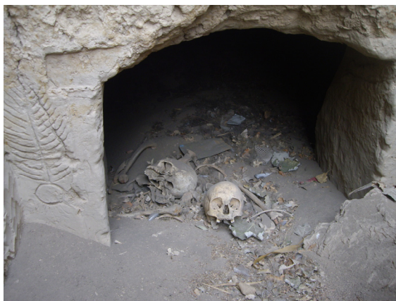
1. kép Teleszemetelt temetkezés az UNESCO-védelem alatt álló Jiaohe lelőhelyen

Az ásatások legtöbbje nagyobb lélegzetű beruházásokhoz köthető, nagy felületű feltárásokból tevődik össze, melyeknek köszönhetően Kína történelme több jelentős lelettel gazdagodott az utóbbi években. Mindezeknek azonban számos negatív hozadéka is van, így például a beruházások tervezési fázisában nem konzultálnak a régészekkel, ezáltal kényszerhelyzetet teremtenek, emellett számos esetben a beruházás a régészeti örökség rovására is megvalósul. A feltárások határideje sok esetben rendkívül szűkös, az anyagi források nem biztosítottak. Szintén komoly problémát jelent a szakképzett tudományos gárda, valamint a törvényi háttér ismeretének a hiánya. 22