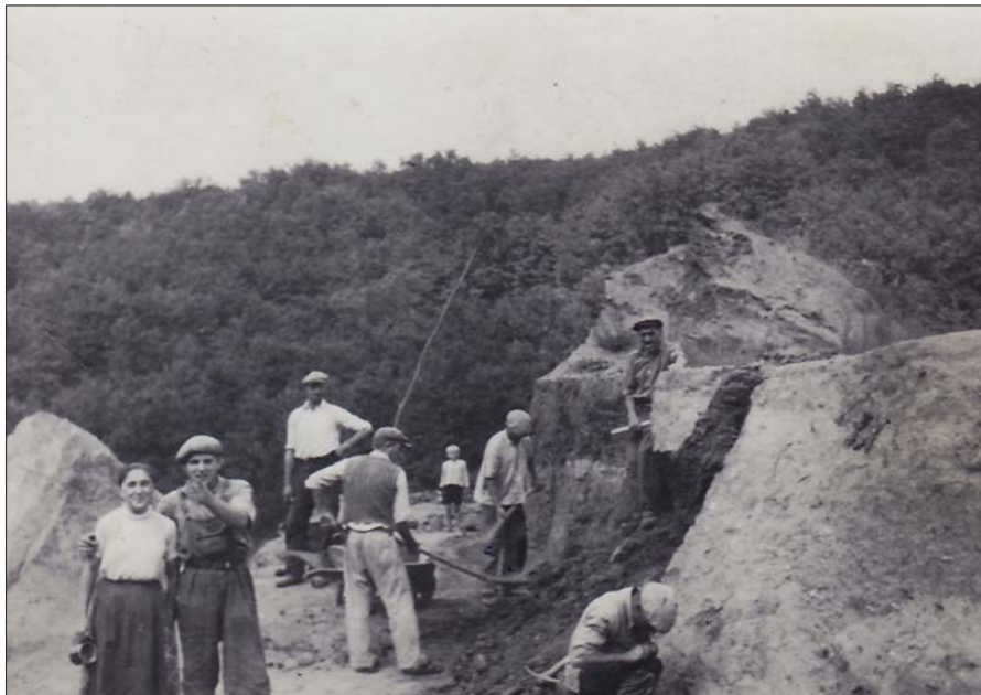
Kőfejtés embert próbáló munkával