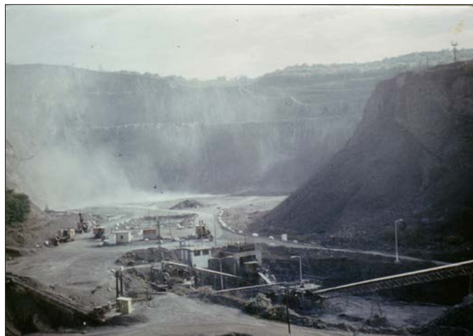
A Komlói Kőbányában