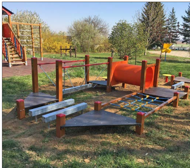
Telepítették az ovi udvarába az új, kültéri játékokat