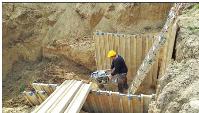
A feltárást követően betemették az iskola udvarán tátongó hatalmas pincebeszakadást

• közösségi terek felújítása 30 M Ft értékben (a Községi Ház nagytermének villanszerelési és felújítási munkálatai)