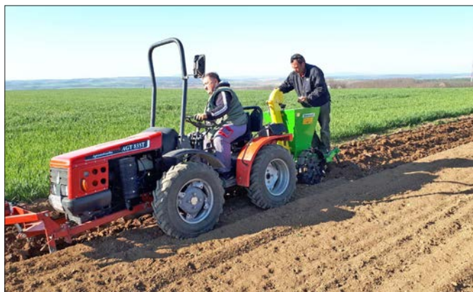
Az önkormányzat konyhakertjében krumplit vetettünk és hagymát dugványoztunk