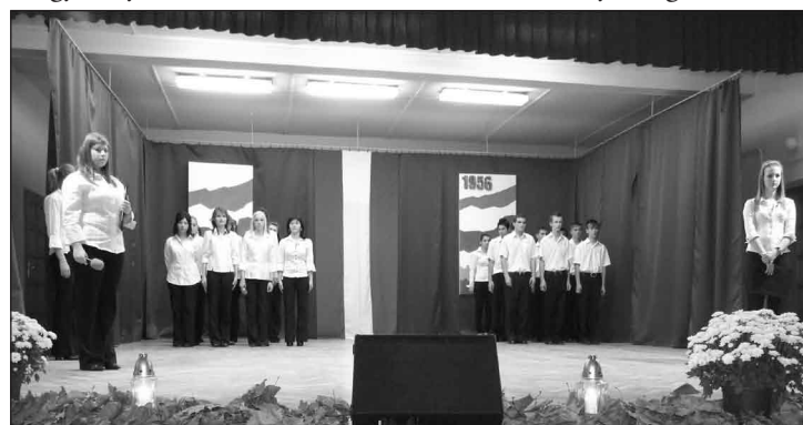
Részlet az 1956-os emlékműsorból

A 2009-es esztendő A Magyar Nyelv Éve. A „Beszélgetés a könyvtárban” előadássorozaton belül, a záhonyi Tiszakönyök Művészeti és Kulturális Egyesülettel közösen ennek alkalmából rendezvénysorozat indult november 17-én. A rendezvény célja a nemzeti önbecsülésnek és az azonosság tudat elmélyítésének, a kulturális közösség összetartó erejének, a magyar nyelvnek, mint a társa-