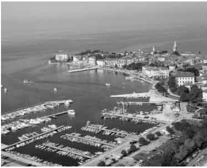
Az isztriai kikötő