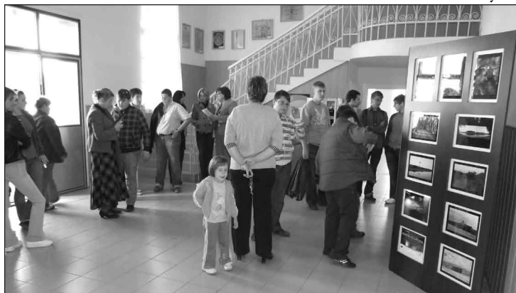
A fiatalok által készített fényképek kiállítása a kultúrházban

Az idei év utolsó véradása november 12-én volt. A nyír-