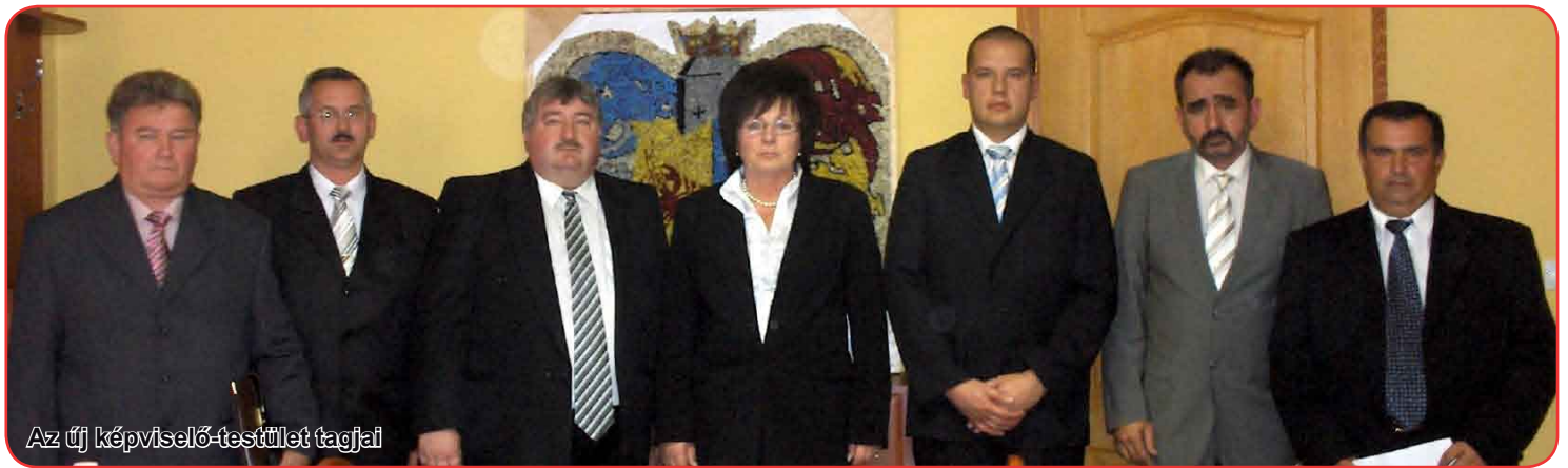
Az új képviselő-testület tagjai