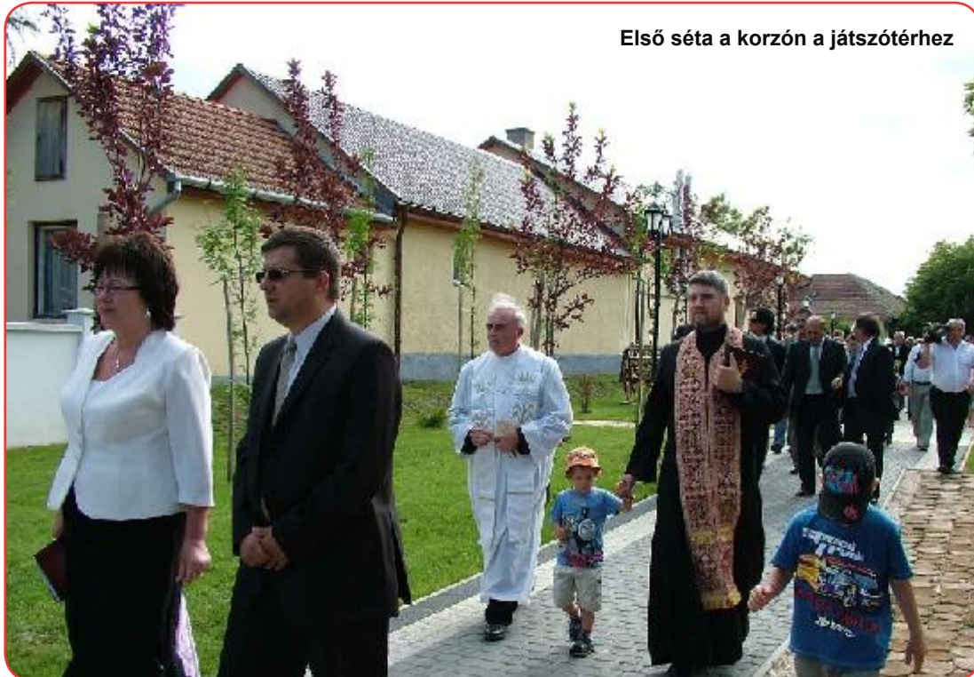
Első séta a korzón a játszótérhez