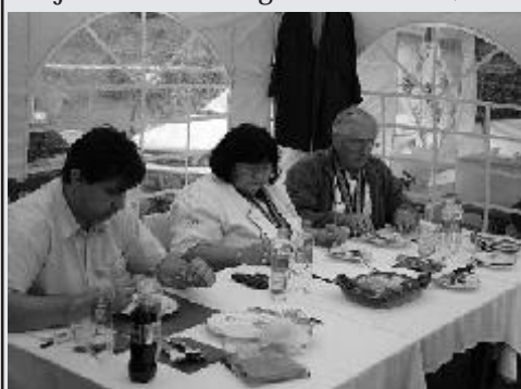
Munkában a Csülkös Nap zsűrije

penybe visszatekercsöljük és diómustárral és mézzel ízesítve pár percig sütjük, majd az első réteg palacsintára terítjük. Ezt újabb réteg palacsintával befedjük. A második adag húst kevés reszelt almával, egy-egy csipetnyi ánizzsal, gyömbérral és fahéjjal valamint kevés mézzel átforrósítjuk. Ezt szintén egyenletesen elosztjuk a palacsintán, majd ismét palacsintaréteg következik. A harmadik adagot felvágott aszalt szilvával, szeletelt mandulával és mézzel ízesítjük, átmelegítjük. Ez lesz a harmadik réteg hús, amit ismét palacsintával borítunk. A tetejét mézzel megcseréltük, hogy jobban tapadjon. 15 percig 150 fokon sütjük. Majd miután kihűlt, szeleteljük és áfonyamártással tálaljuk.