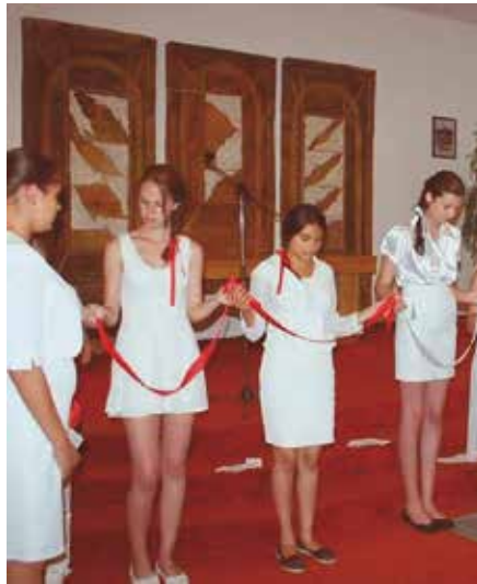
Nemzeti összetartozás napja: 2016. június 4-e