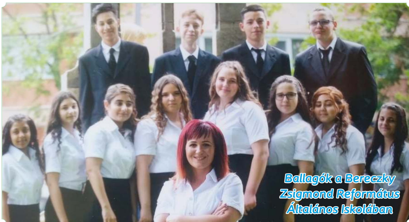
Ballagók a Bereczky Zsigmond Reformatus Általános Iskolában