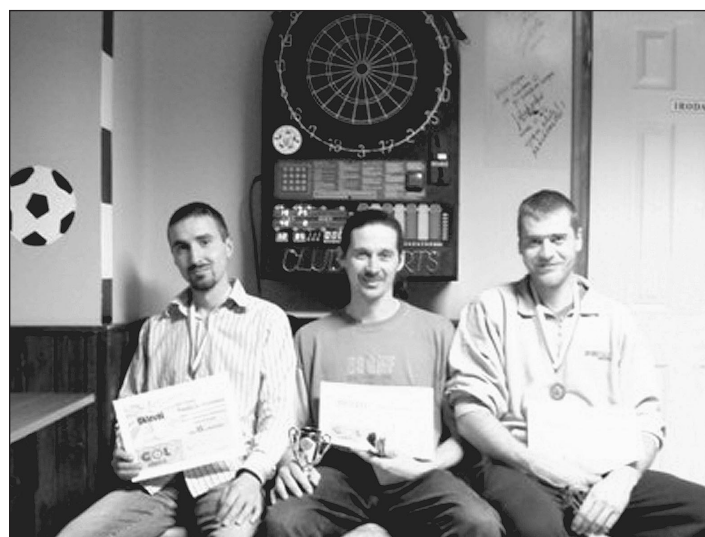
A verseny győztesei

Következő Farsang Kupa Darts versenyünk 2009. február 15-én (vasárnap) 14 órai kezdettel kerül