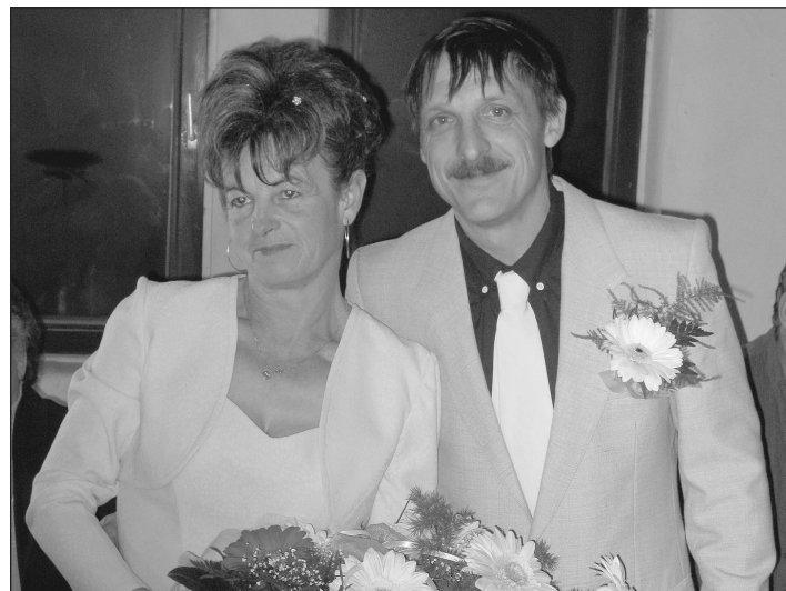
A boldogító igen után