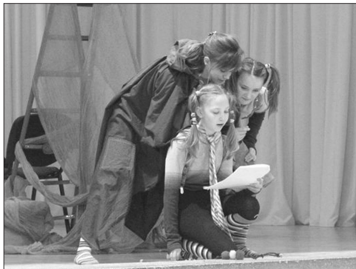
A kis színjátszók

Izgalommal készült minden résztvevő, hogy megmutassa mit sajátított el az első félév alatt. A kicsi színjátszóktól láthattuk Tündérszép Ilona és Árgyélus történetét. Nagyon kidolgozott, szépen megvalósított előadás volt.