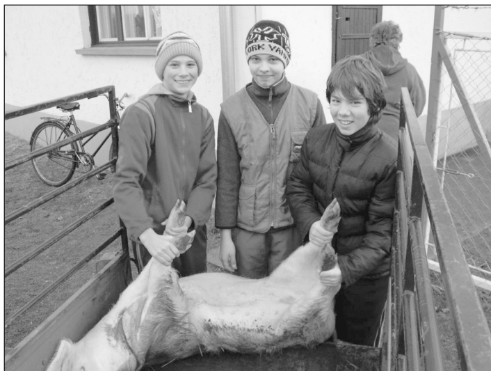
A csapat tagjai az áldozattal