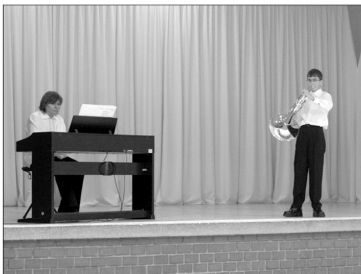
A zenés produkciók egyike