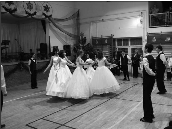
A nyitó tánc

A műsort az ütő együttes produkciója zárta. A Mikulás báliforgatagot a 8. osztályosok nyitó tánca kezdte. A mulatozás közben megérkezett a Mikulás, akinek segítségével nagyon sok értékes tombolatárgy került kisorsolásra, ezután pedig hajnalig tartott a bál, reméljük mindenki meglegedésére.