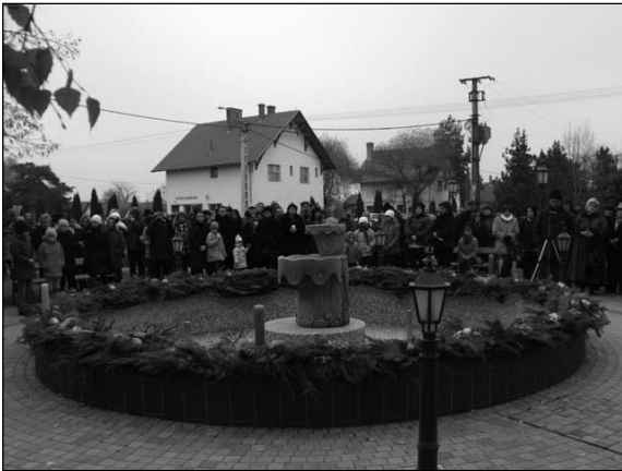
Az adventi koszorú