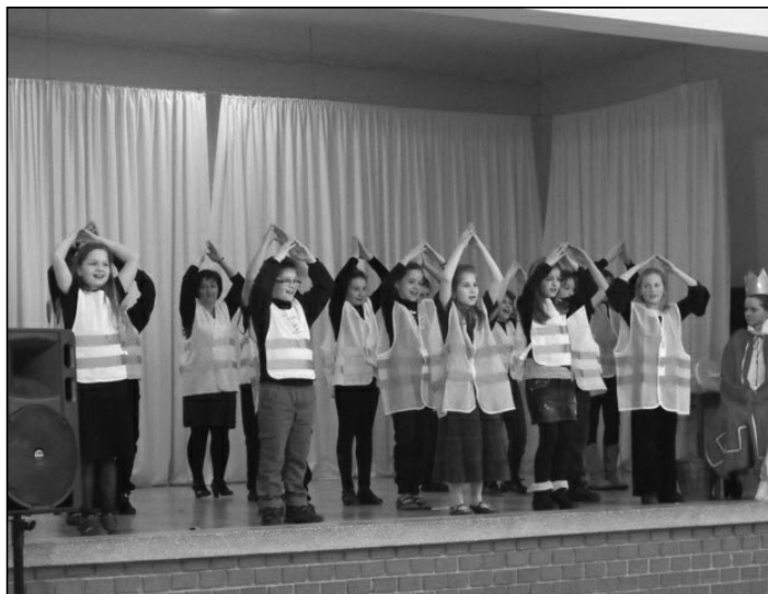
A negyedikes kiscinegék

2013. február 8-án rendezték meg az általános iskolások farsangját a Faluházban. Az első és harmadik osztályosok egyénileg mutatták be jelmezeiket. A második osztályosok kiscsibéknek öltöztek be és a Kukori és Kotkoda című mese zenéjére adtak elő egy táncot. A negyedikesek cinegék voltak és az Alma együttes Nád a házam teteje számára táncoltak.