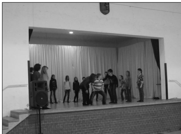
A színjátszósok Brekekex című darabja