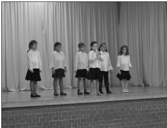
A kis furulyások