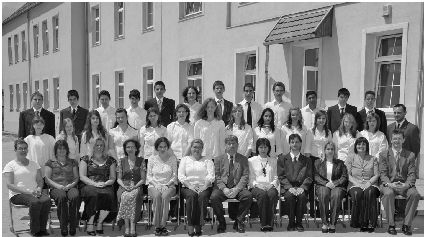
Gábor Áron Általános Iskola Hajmáskér 2008