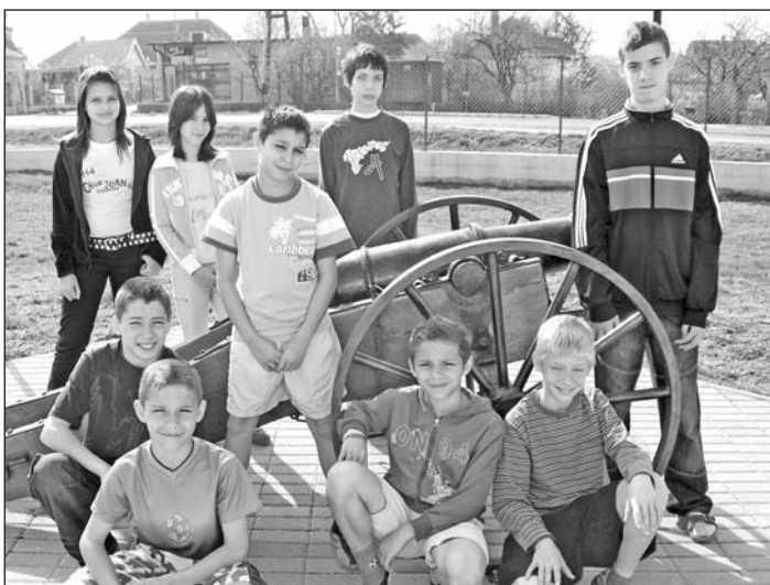
Országos döntőbe jutottak