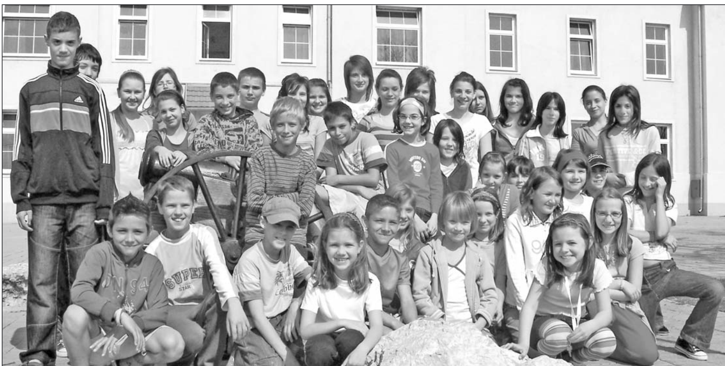
A versenyeken résztvevő diákok