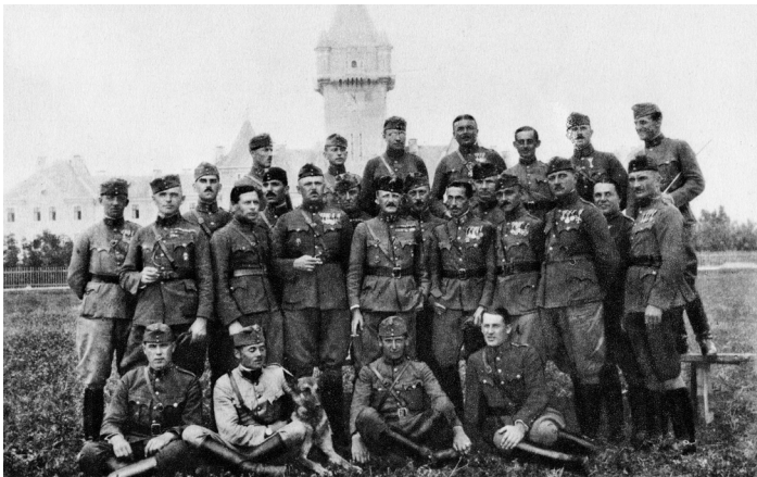
Hajmáskéri tüzérek a kastély előtt 1932-ben