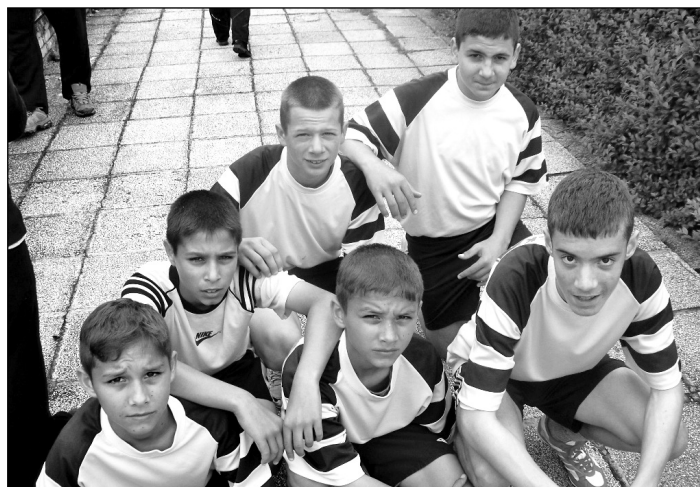
OB. 6. helyezett többpróba csapat