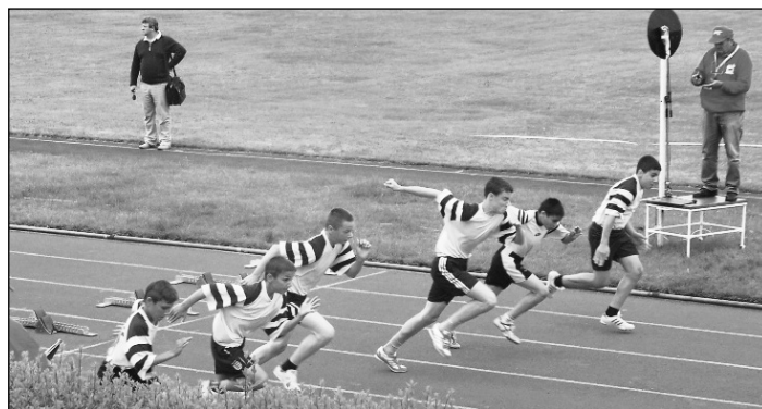
OB. 6. helyezett többpróba csapat 60 m futás