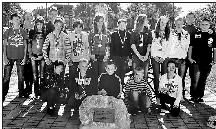
A sportsikereket elért tanulók csapata és felkészítőik