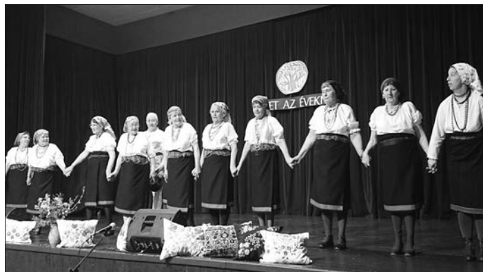
A Vadgalamb Népi Táncsoport részt vett a jó hangulatú megyei néptáncfalalkozáson a Pétfürdői Községi Házban.