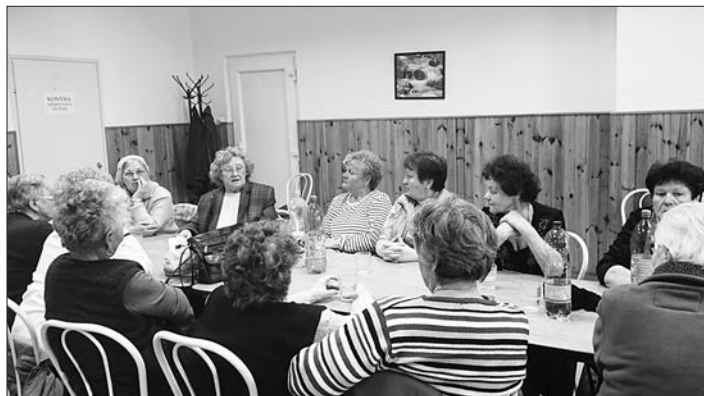
Gyönyörű versekkel emlékeztek meg a Költészet napjáról a nyugdíjas klub tagjai.