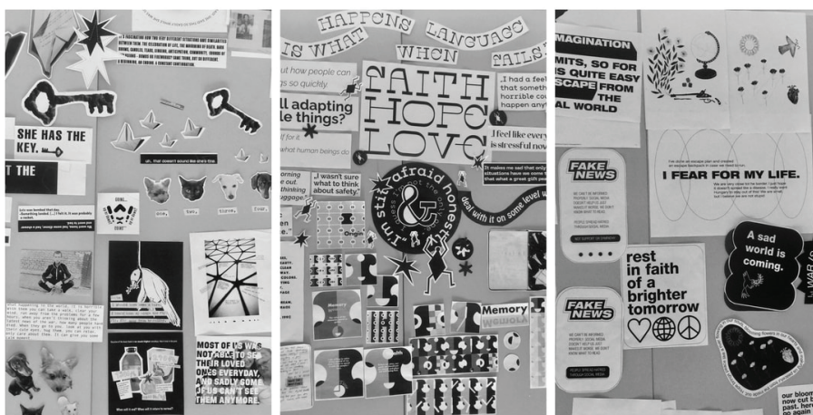
2. kép. A háborúval kapcsolatos érzelmekre reagáló mood boardok