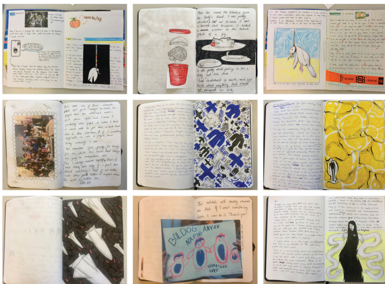
1. kép. A kutatás háttérét adó vizuális naplók