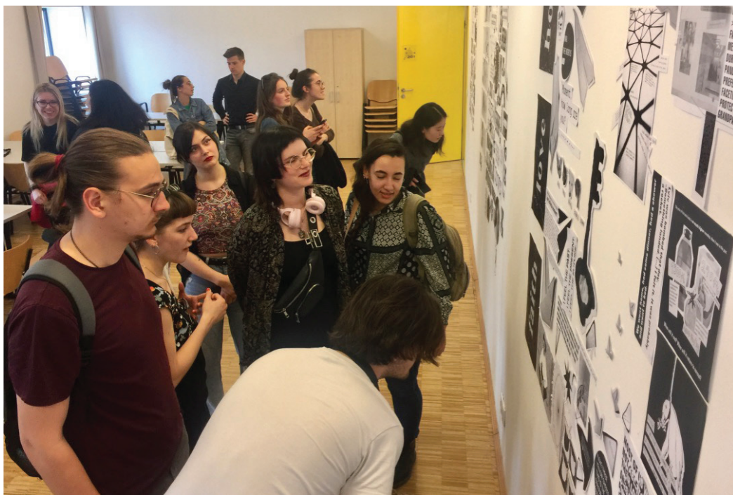
4. kép. Workshopot záró kiállítás, PTE Kommunikáció és Médiatudományi Tanszék, 2022. május 6.