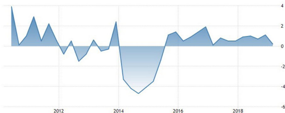
2. ábra. Ukrajna GDP-növekedése 2013–2018 közötti időszakban