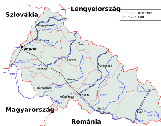
1. ábra. Kárpátalja határai