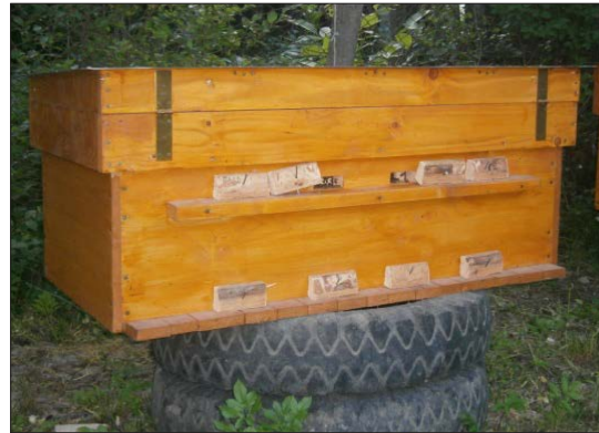
1. ábra. Fekvő kaptár

a méhcsalád, de a megfelelő méhlegelő nélkül nem ér el jó eredményt a méhész. A méhészet alapja a múltban, jelenben és jövőben is a méhlegelő. A méhcsalád fejlődésének lendületes és folyamatos segítéséhez, gyűjtőképességének eléréséhez viszont fontos a kaptár, a kaptár alakja, típusa, belső szerkezete, nagysága, kezelhetősége. A kaptártípusok sokasága miatt nem vállalkoztam arra, hogy minden típust felmérjek. Ehelyett arra orientálódtam, hogy fekvő vagy rakodórendszerben méhészkednek-e a méhészek.