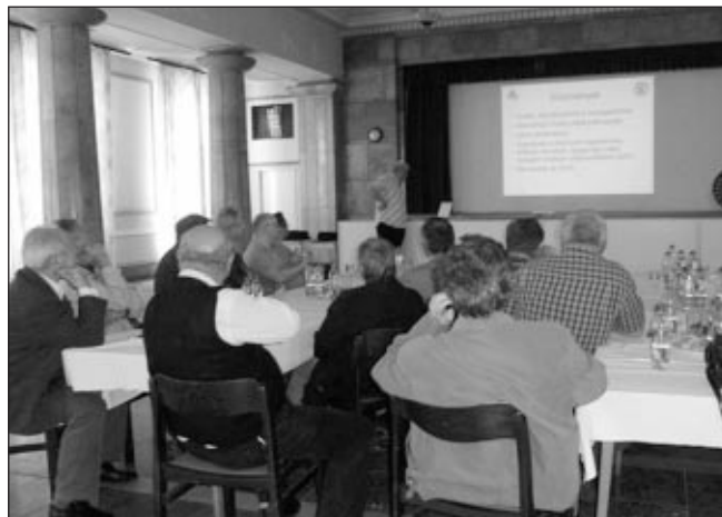
1. kép. Az előadások hallgatósága

Mindkét előadónak sok kérdést tettek fel a hallgatóság sorából. Az előadások után a vendégek egy üzemlátogatás kere-