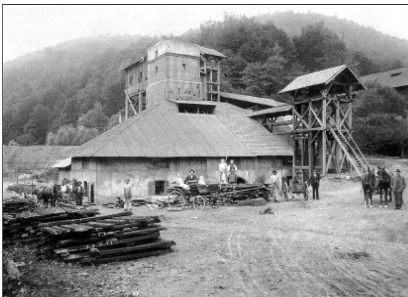
A dobsinai felső kohó a 19. sz. végén

A 16–18. században a magyarországi vasgyártás egyik központja Dobsina volt, amelyet az 1340 táján betelepített szászok alapítottak. 1417-ben már mezőváros. A környező hegyekben az arany, ezüst és réz mellett főleg vasat bányásztak. 1556-ban három olvasztókemence és három hámor működött, négy hámor pedig üzemem kívül állt, 1592-ben pedig egy massa és hét hámor dolgozott. (A massa a vasbuca latin massa ferri nevéből származik, és Magyarországon legkorábban 16–17. századi forrásokban fordul elő, kizárólag Dobsinára vonatkozó szövegekben, jelentése: vasolvasztó kemence.)