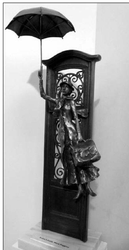
■ A Mary Poppins -szobor