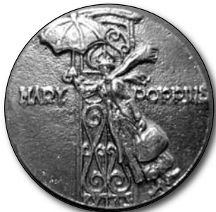
■ A kiállítás megnyitójára készült érem elő- és hátlapja