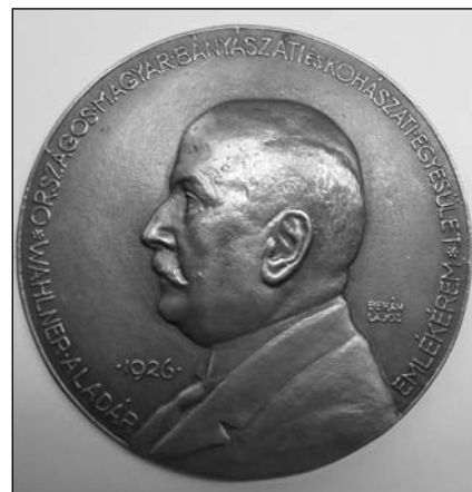
■ 2. kép. Wahlner Aladár portréja az OMBKE emlékérmén, Berán Lajos (1882–1943) alkotása 1926-ból