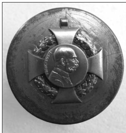
■ 1. kép. Jubileumi kereszt 1908, Ferenc József trónra lépésének 60 éves jubileumára

További technológiai kihívás a harmadik oldal, az érmék palástjának, díszítésének, feliratainak láthatóvá tétele, amelyet az érem elő- és hátlapjával szükséges összhangba hozni. Látható, hogy a véset elkészítésénél a gyártás, különösen a sorozatgyártás feltételrendszerét is figyelembe kell venni és szükséges alkal-