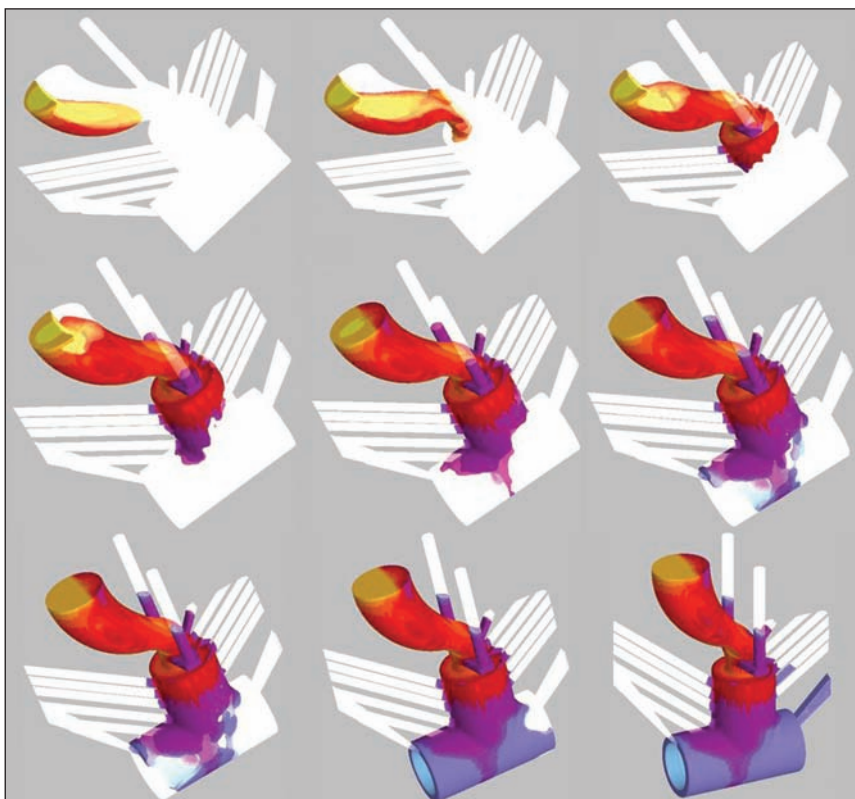
4. ábra. A formatöltődés folyamata