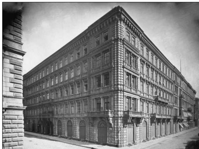
■ 4. kép. A Ganz-palota Széchenyi utcai és rakparti homlokzata

megkapta a Ferenc József-rendet, 1865-ben a császár is meglátogatta gyárát. A korabeli sajtó szerint a gyár termékei „nemcsak a tulajdonosnak, de az egész országnak dicsőségére válnak”.