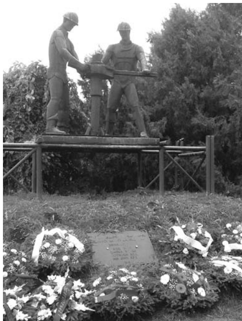
Olajbányász szobor Szolnok

Az OMBKE Kőolaj-, Földgáz- és Vízbányászati Szakosztály Alföldi Helyi Szervezet (KFVSZ AHSZ) kezdeményezésére és szervezésében a 66. Bányásznapi tiszteletére és saját maguk megbecsülésére a Szolnokon lévő kőolaj- és földgáz-bányászathoz kapcsolódó szervezetek 2016. szeptember 5-én