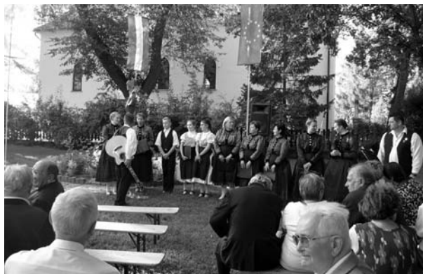
A Gánti Német Hagományörző Énekkar műsora a Szent Borbála-szobornál