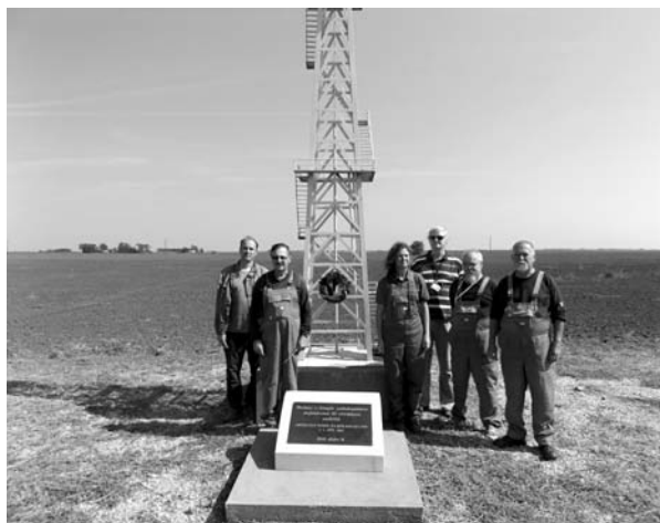
Koszorúzás a Pf-1 kútnál

A MOL Magyarország Kelet-magyarországi Termelés Orosházához tartozó területén lévő emlékhelyeken (Pusztaföldvár-1. és Battonya-37.) a 66. Bányásznapi tisztele-