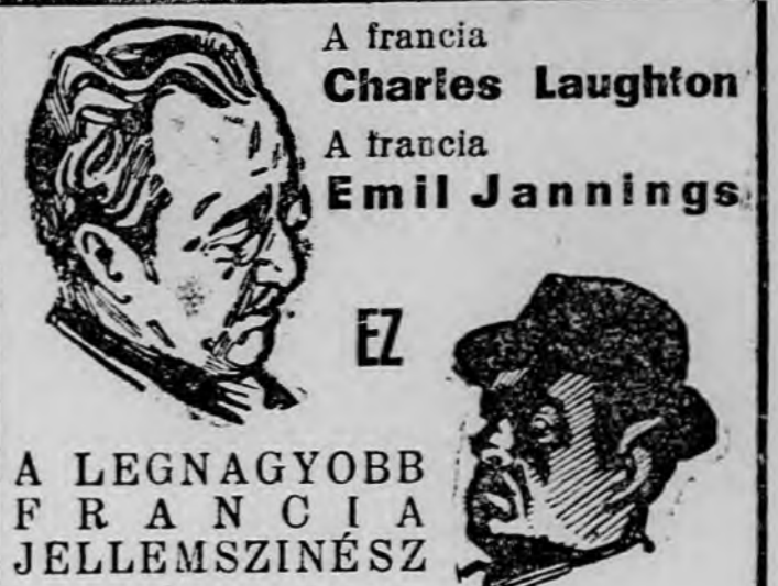
A francia Charles Laughton A francia Emil Jannings

Negyedtíz mutat az óra, mikor a soha nem látott szín pompás körmenet végétért és megkezdődött a szentmise a Koronázó Mátyás-templomban. A körmenet százezrekre menő nézőközönsége kipirult arccal, csillogó szemmel