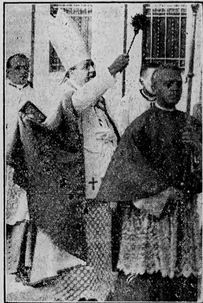
Szerédi herecegprimás vasárnap délelőtt felszentelt az új ferencvárosi plébániatemplomot.