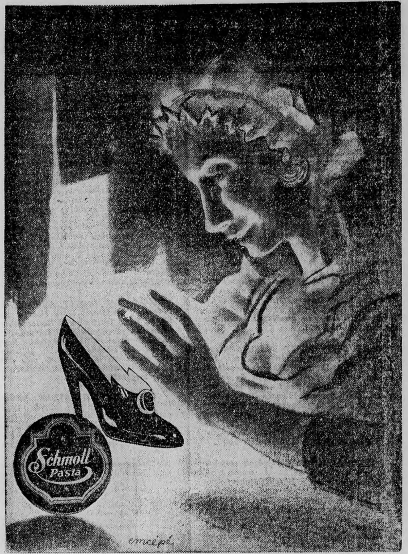
Kedvesem ha Schmolli-t használsz, Mindig új cipőben jársz!