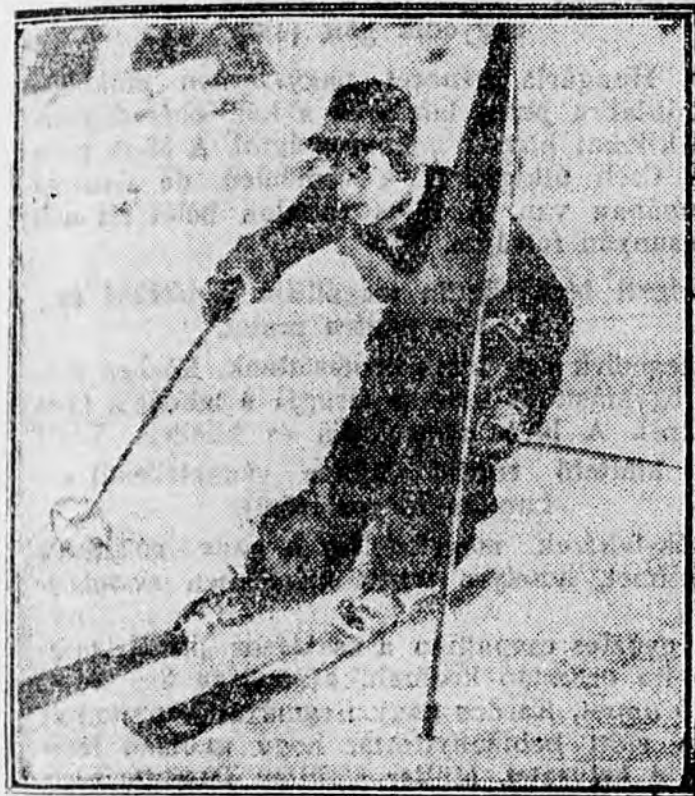
Christl Cranz az első olimpiai bajnok.

Szombaton este, mint valami mesebeli város, olyan volt Garmisch-Partenkirchen. Ezer és ezer villanylámpa fénye szűrődött ki a hotelekből, ahol a világ minden tájáról összesereglett bajnokok és internacionális közönség estélyi ruhákban, frakkban, szmokingban ült a hotel-hallok-