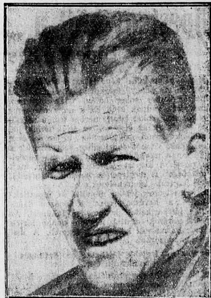
A lemaradt favorit: Birger Ruud.

A franciák a mérkőzés vége felé többet támadtak, több kedvező gólhelyzetük is volt, az ered-