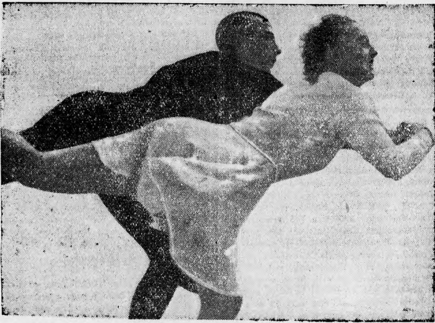
NEMET BAIER—HERBER-PAR, ROTTER—SZOLLÁSÉK LEGERŐSEBB ELLENFELEI.