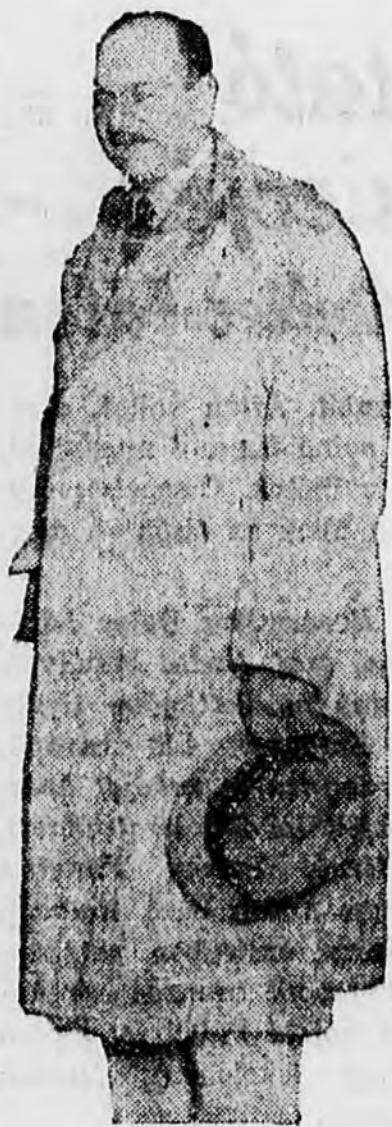
Flandin kiszélesíti a Londonnal való közvetlen tárgyalások alapjait

Megjósolják azonban, hogy meglehetősen heves politikai küzdelemre van kilátás.