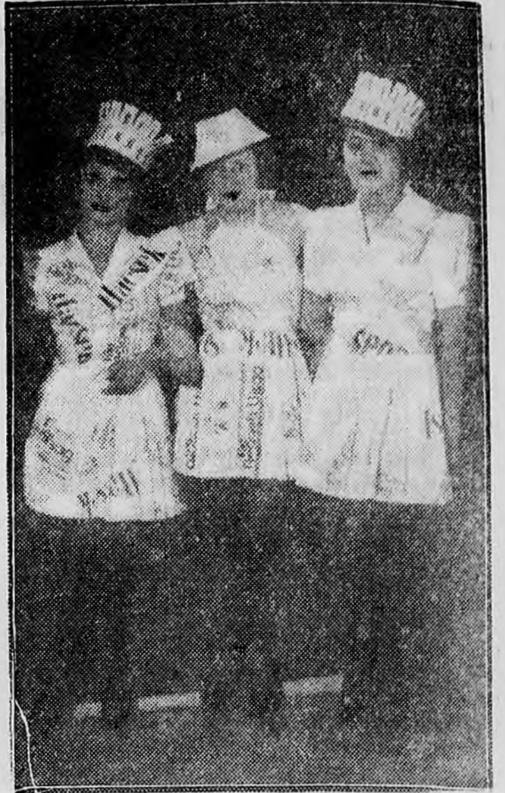
HÁROM FIATAL URILÁNY REGGELI UJSÁG- JELMEZBEN AZ ATELIER-BÁLON