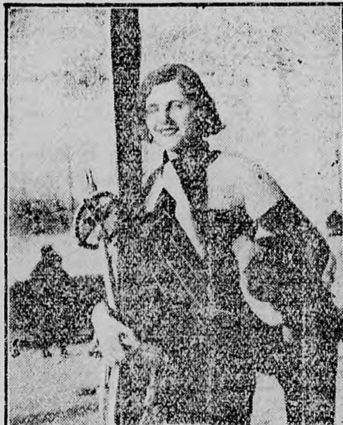
Egy pesti si-szépség a Normafánál.