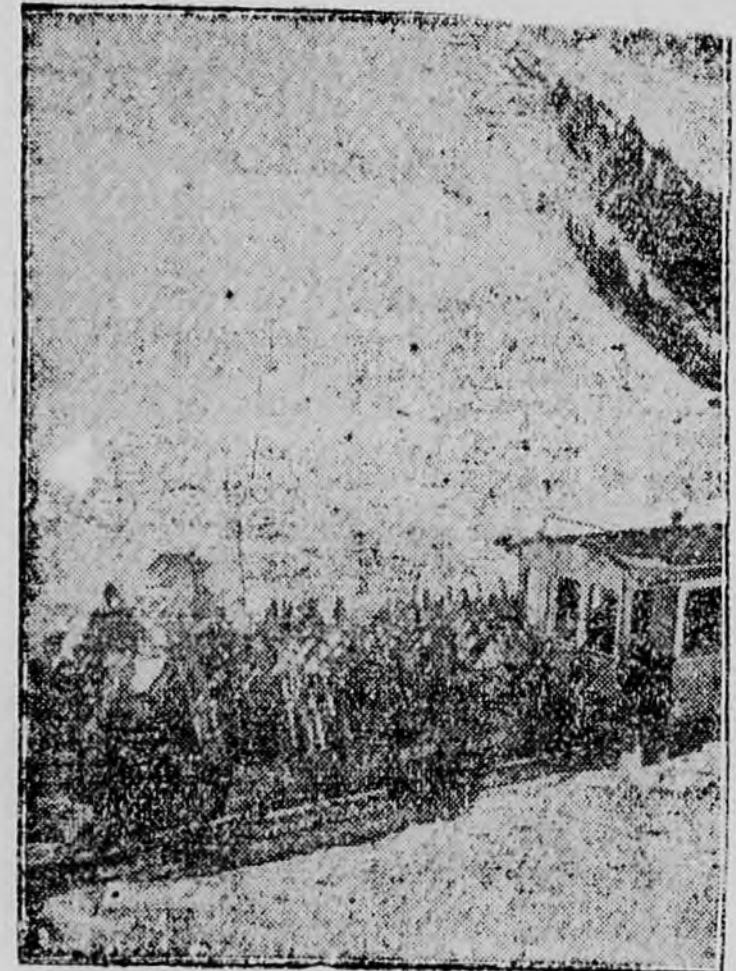
Viszl a fogas a sítalpak százált.

Reggel 6 órakor indultak el az első elszánt sielők és 9 óra felé már hatalmas autótábor