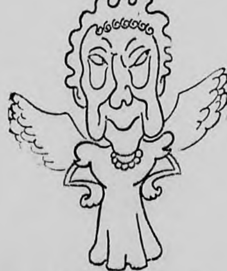
ADELE SANDROCK ez az ördögi nő a ház anyala...