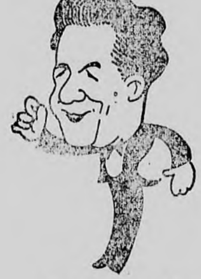
PAUL HÖRBIGER ő egyenesíti a női orrokat — és ő rendezte a görbe éjszakát!