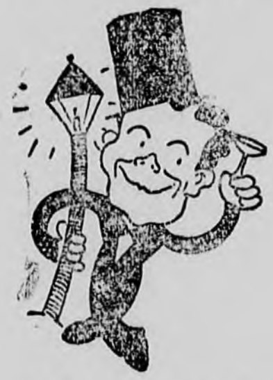
HERRMANN THIMIG ő tévedt be részeg fővel öngyisága hálszobájába

A cenzura a filmet nevetve engedélyezte! A nagy mulatság négy mulatságos főszereplője: