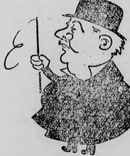
SLEZÁK LEÓ az utolsó bécsi konflis, a legelső énekes...

A film Bécsben „Der Herr ohne Wohnung” cím alatt kacagóvihart keltett és nevetőorkánt aratott!