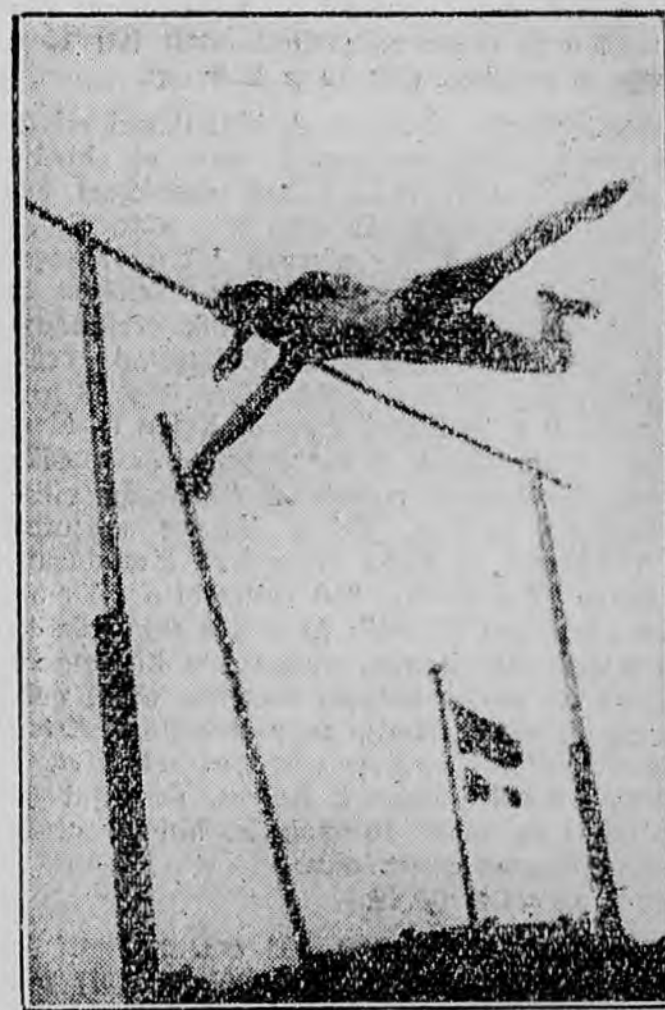
Zsuffka átugorja a 403 cm rekordmagasságot

melyért hosszantartó tapssal jutalmazták, 800 méteren a játszva győző Lanzi mögött imponált Ignátz stílusos futása.