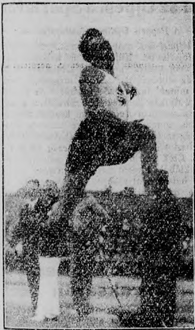
Dombóváry 741 cm távolugrása

főnyi érdeklődővel. Hiába van gazdasági válság, a magyar-olasz atletikai mérkőzés mit sem veszített varázsából.