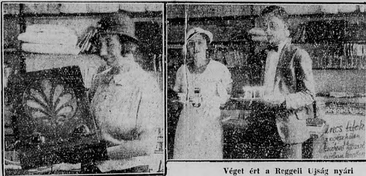
Véget ért a Reggeli Ujság nyári keresztrefjéversenye