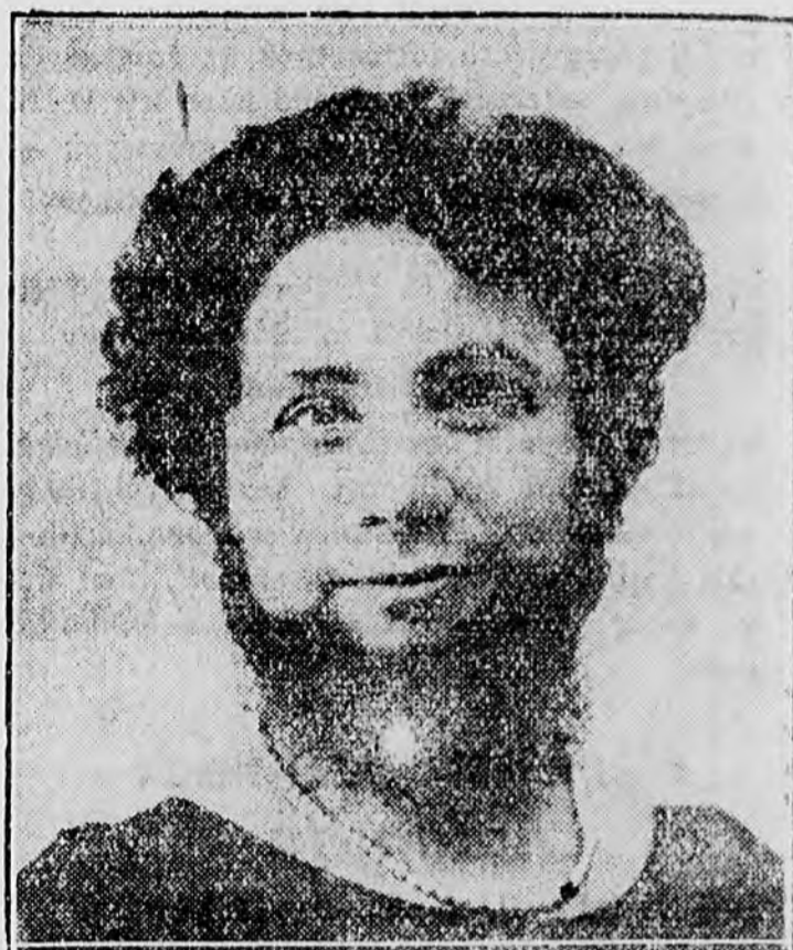
A szakállas nő — aki eltűnt a vurstliból.