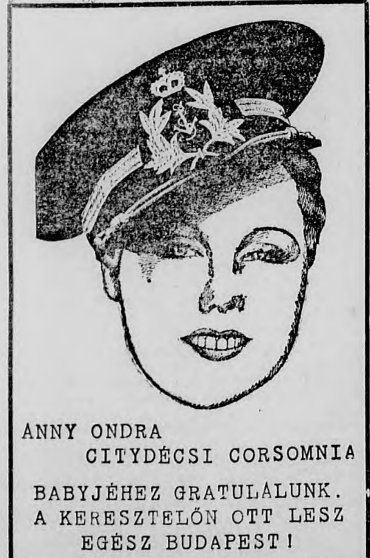
ANNY ONDRA CITYDÉCSI CORSOMNIA BABYJÉHEZ GRATULÁLUNK. A KERESZTELŐN OTT LESZ EGÉSZ BUDAPEST!

Eszméletlen állapotban, a veronalmérgezés súlyos tüneteivel találták meg reggel és azonnal szanatóriumba szállították. Az orvosok minden lehetőt elkövettek, hogy megmentsék az életnek, ez azonban nem sikerült. Az elmúlt hét közepén egy kissé javult ugyan az állapota, de szombaton