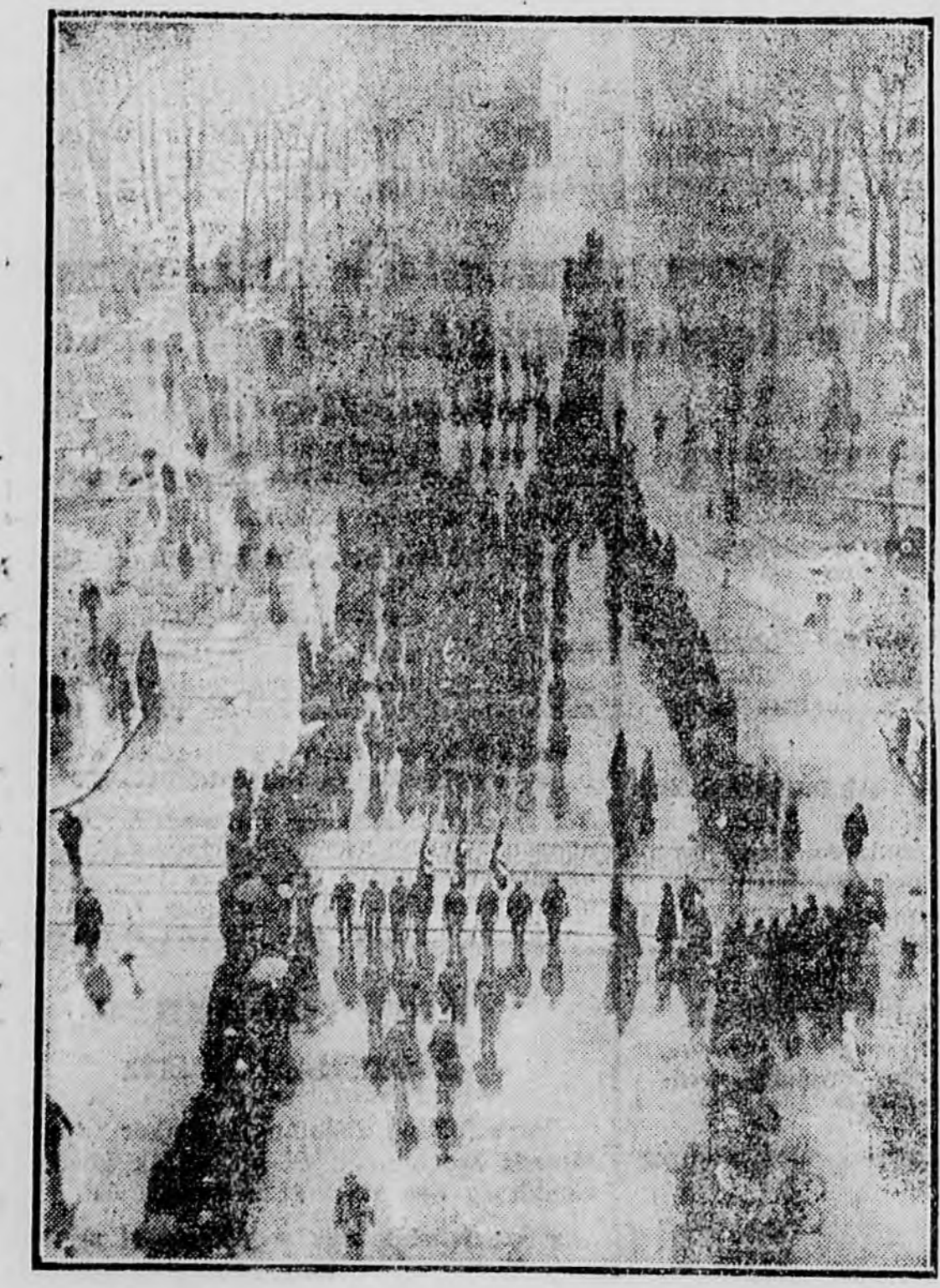
Hitler, zászlós rohamcsapatának felvonulása a vasárnapi választást megelőzően a Branderburgi kapu környékén

Az este tíz órákor kiadott hivatalos jelentés szerint az addig összeszámolt szavazatokból 5,113,863 eset Hitlerre, Hugenbergre 697,445, a német néppártra 143,032, vagyis összesen a Hugenberg-Hitler blokk 6,076,179 szavazatot kapott. Ezzel szemben a szocialistákra, a kommunistákra, a választásokon legfeljebb a leadott szavazatok 33,1 százaléka esett, míg az esti tíz óráig megszámlált szavazatokból 43,8 százalék esett rá. Hitler táborra tehát 10 százalékkal megnövekedett. Meggyengült Hugenberg is, de nagyon feltűnő a szociáldemokraták visszaesése. A rájuk adott szavazatok száma 20,2 százalékról 17,1 százalékra esett.