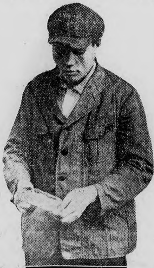
Van der Lubbe holland kommunista, aki a Reichstagot felgyújtotta

Berlinben este hat órakor valamennyi szavazóhelyiségben lezárta a szavazást és nyom-