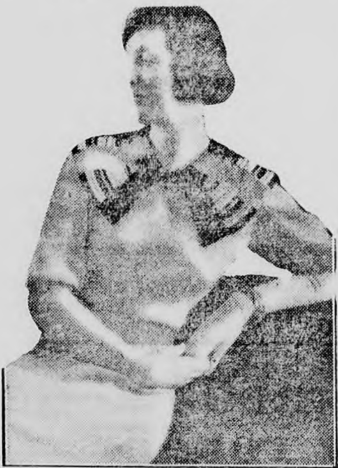
Szürke jumper, nagy színes gallérral

Orvosiilag megállapított tény, hogy a rendszeresen adagolt