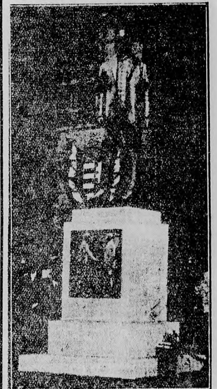
NAGYATÁDI SZABÓ ISTVÁN SZOBRA

A lelkes tapsal fogadott beszéd után az erdőcsokonyai kiszáda dalárda elénekelt a kiszáda fohászt, majd a főváros nevében Liber Endre polgármesterhelyettes vette át a szobrot. Az ünnepség záróbeszédét Berký Gyula, a nagy-