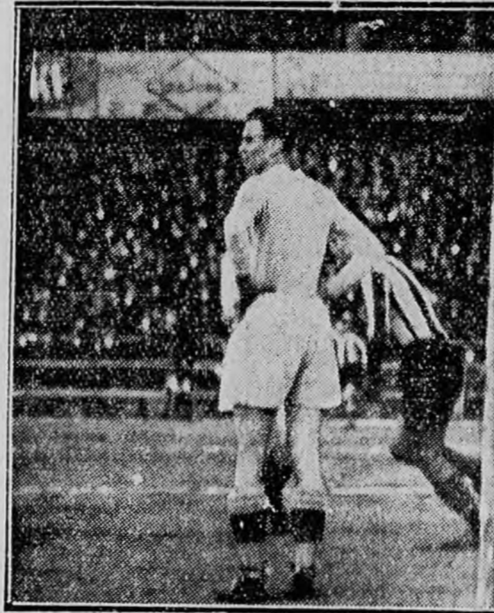
A Ferencváros első gólja

Kohut gyönyörű íveléssel küldi a labdát, éppen úgy, ahogy annakidején Tóth István szokta a kornereket rugni. A labda bekanyarodik az újpesti kapu felé, egyszerre ugrik fel a magasba Aknai és Sárosi. Az újdonsült centeresatár feje azonban előbb ér a labdához és bent van az első ferenc-