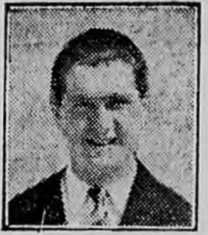
IFJ. HORTHY MIKLÓS, aki Debrecenben nagy beszédet mondott a vidéki sport fejlesztéséről