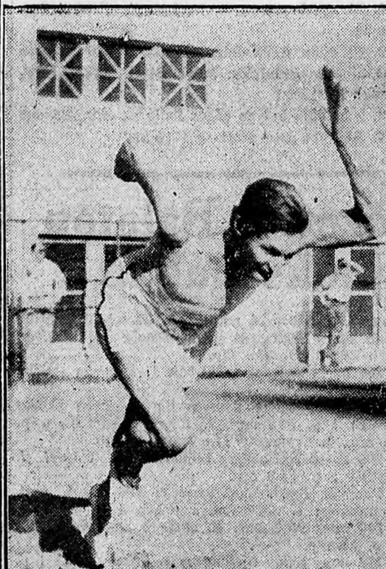
mérték és a stopper a négy bíró ítéletét igazolta.

Los Angeles. A hetedik nap után a nemzetek pontversenye nem hivatalos kimutalás szerint a következő: USA 328 1/2, Finnország 91, Németország 71, Anglia 68, Svédország 65 pont. A többi változatlan.