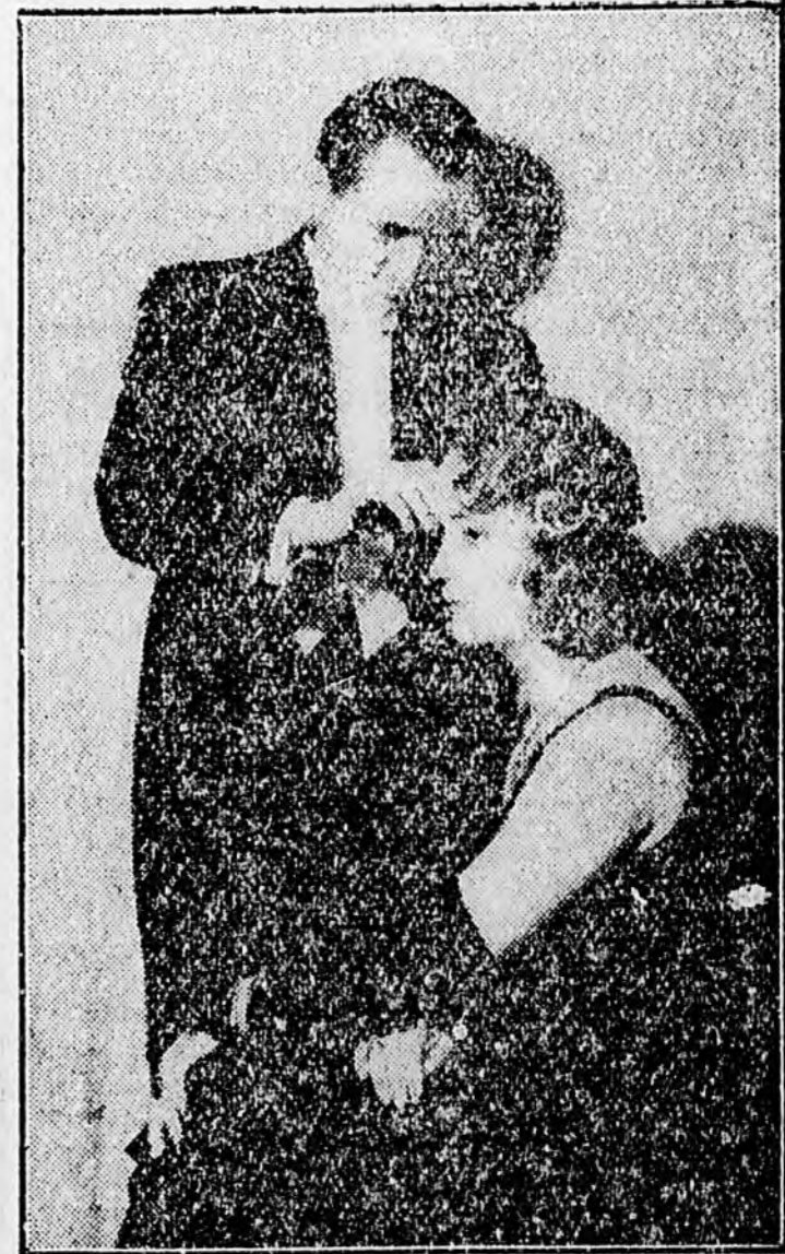
KÉP A FODRÁSZVERSENYRŐL

Bravuros munkát végeztek a vizondolálóverseny résztvevői. A férfi hajógóverseny után került sor a vasondolálóversenyre. Ez a szer-