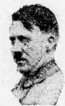
Hitler Adolf, a „náci“ elnökjelöltje, e pillanatban Hindenburg ellenfele

Hindenburg eredeti aláírásával ellátott nyilatkozat, amelyben hivatalosan is bejelenti a birodalmi elnökválasztási harcban való részvételét.