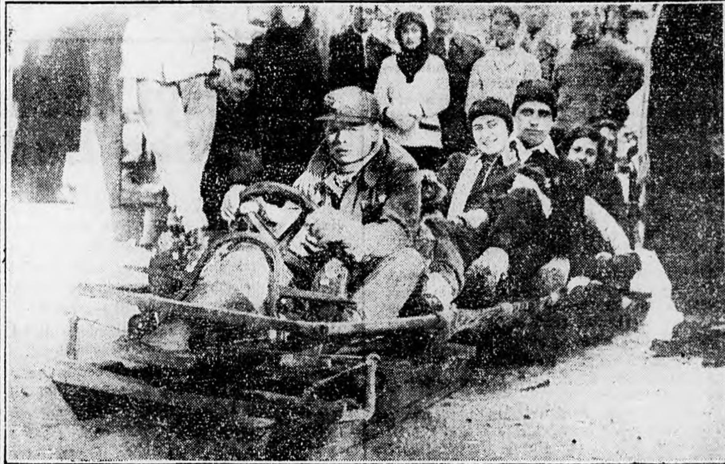
A fiatal Mihály trónörökös nővére, Eleána her cegnő és annak férje, Habsburg Antal főherceg társaságában sportol.