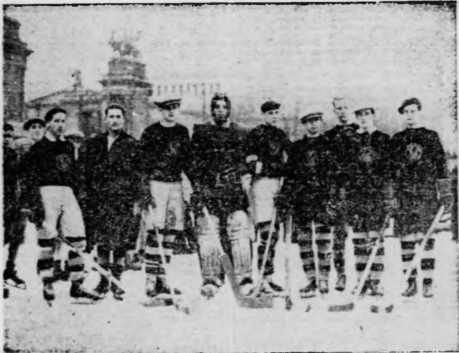
A Magyar Hoki Club győztes csapata