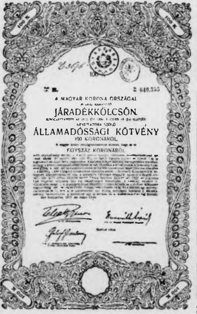
E hadikölcsönkötvény mai értéke 25 fillér — nyomdai előállítás: 75 fillér

A békeszerződés szerint Magyarország nem felelős az ugynevezett utódállamok kormányai vagy állampolgárai tulajdonában levő hadikölcsönökért. Miután a rendelkezésre álló