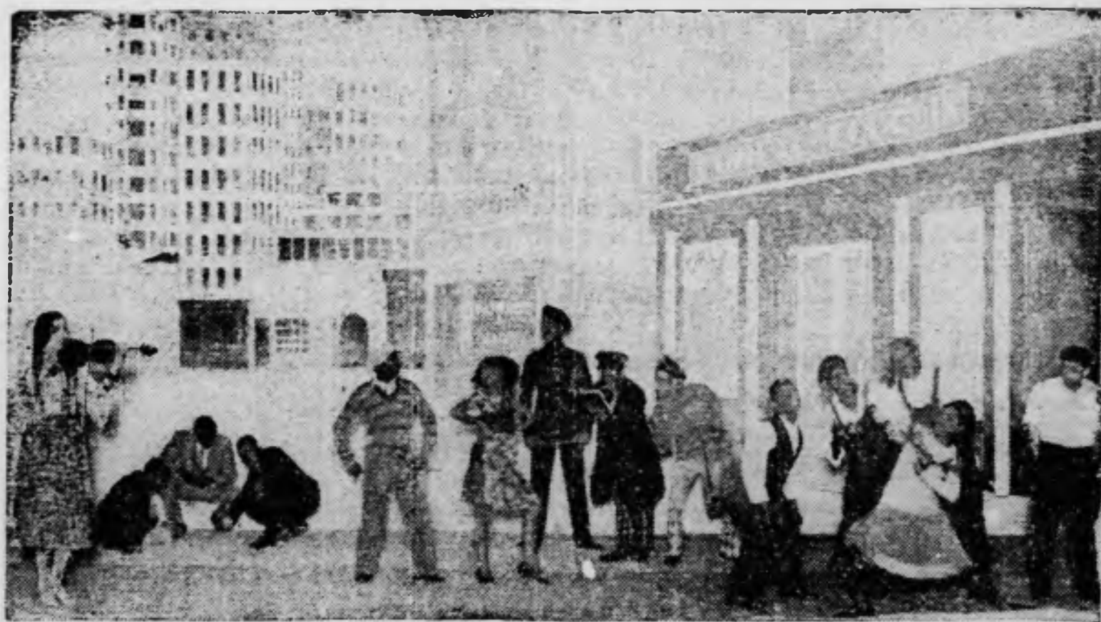
Newyorki utcai jelenet a Royal Orfeum néger-revüjéből