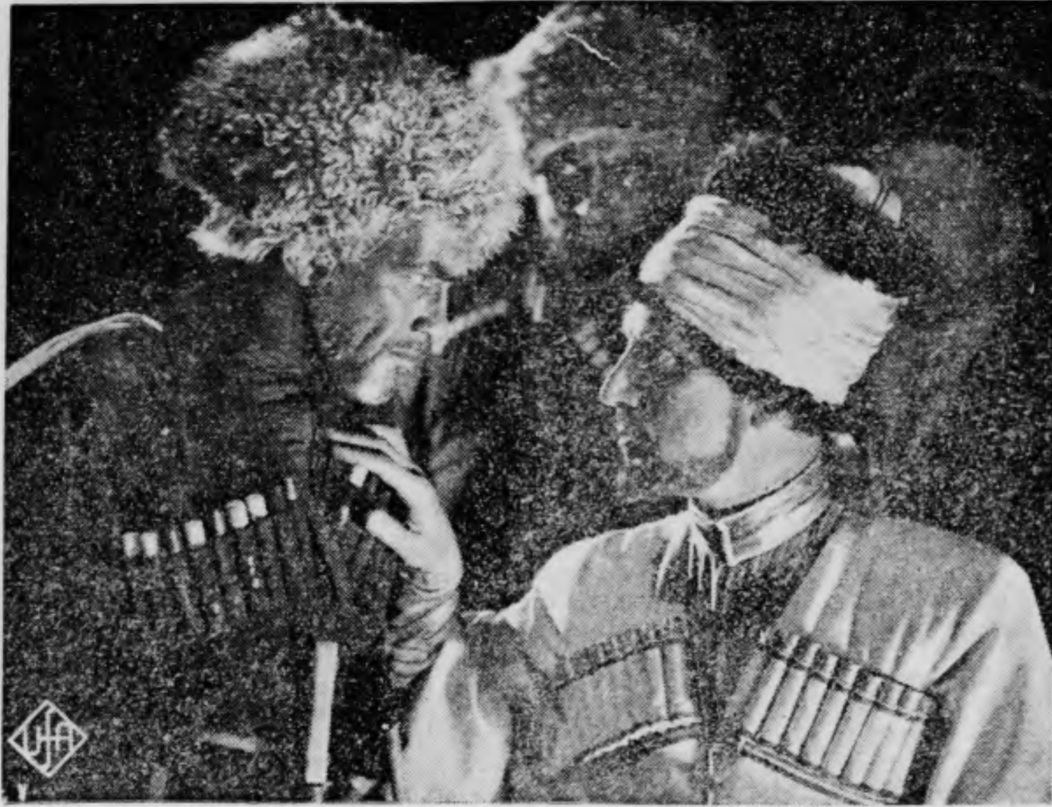
Az új Ivan Mosjoukine-film, a «Hadszi Murat»

meccs után, vonaton, hajón, repülőgépen és a halálós ágyon jó kipróbált amerikai gramofonlemezek harsognak a nézőtér fölébe — a differencia csak annyi, hogy a vásznon egy-