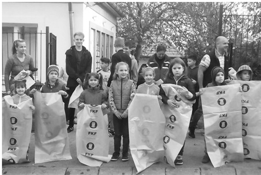
Őszi takarítás: Idén az elsősök jelentős számban, szüleikkel együtt résztvettek a munkában.